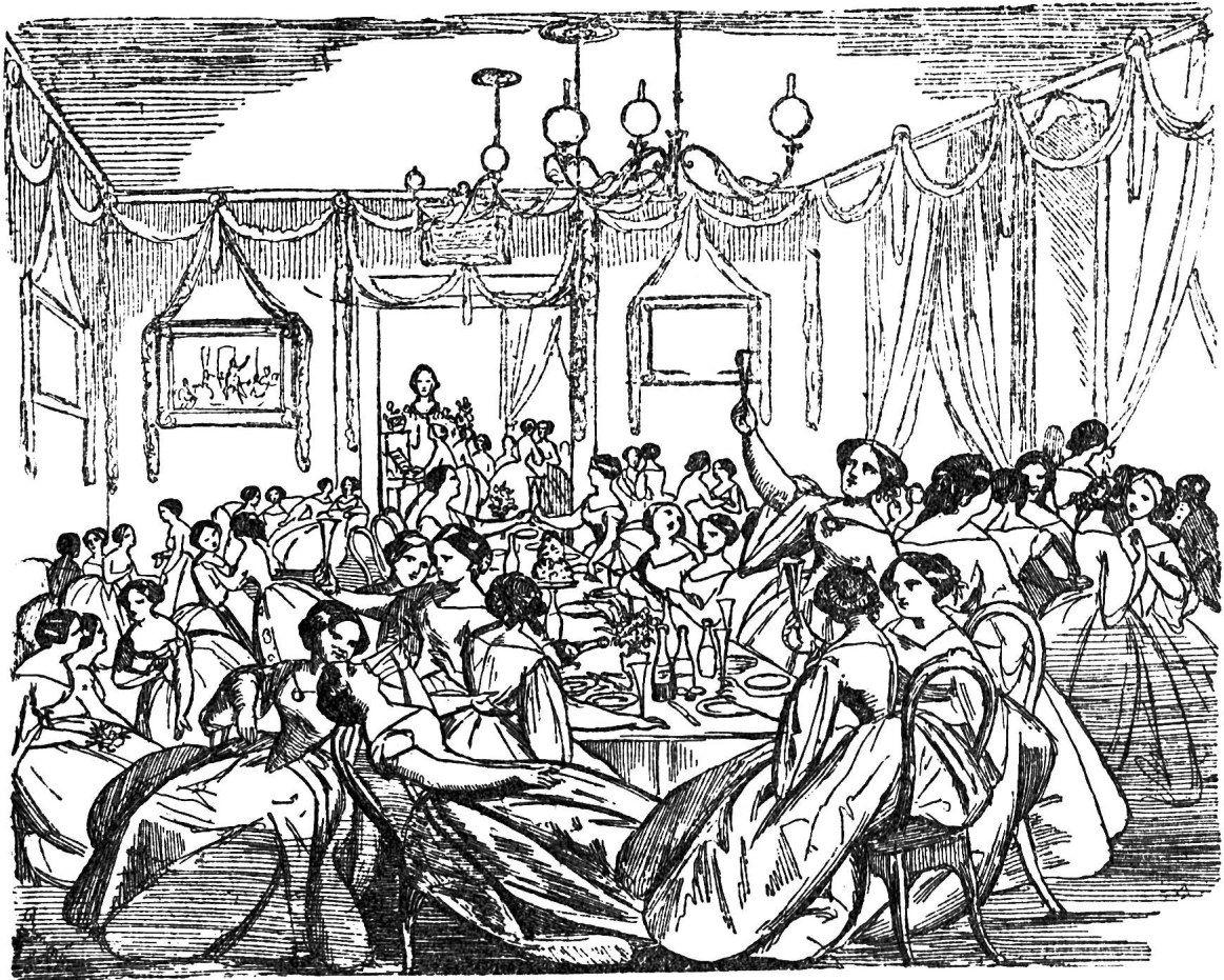
„Denn wo das Strenge mit dem Zarten, wo Starkes sich und Milbes paarten, — —