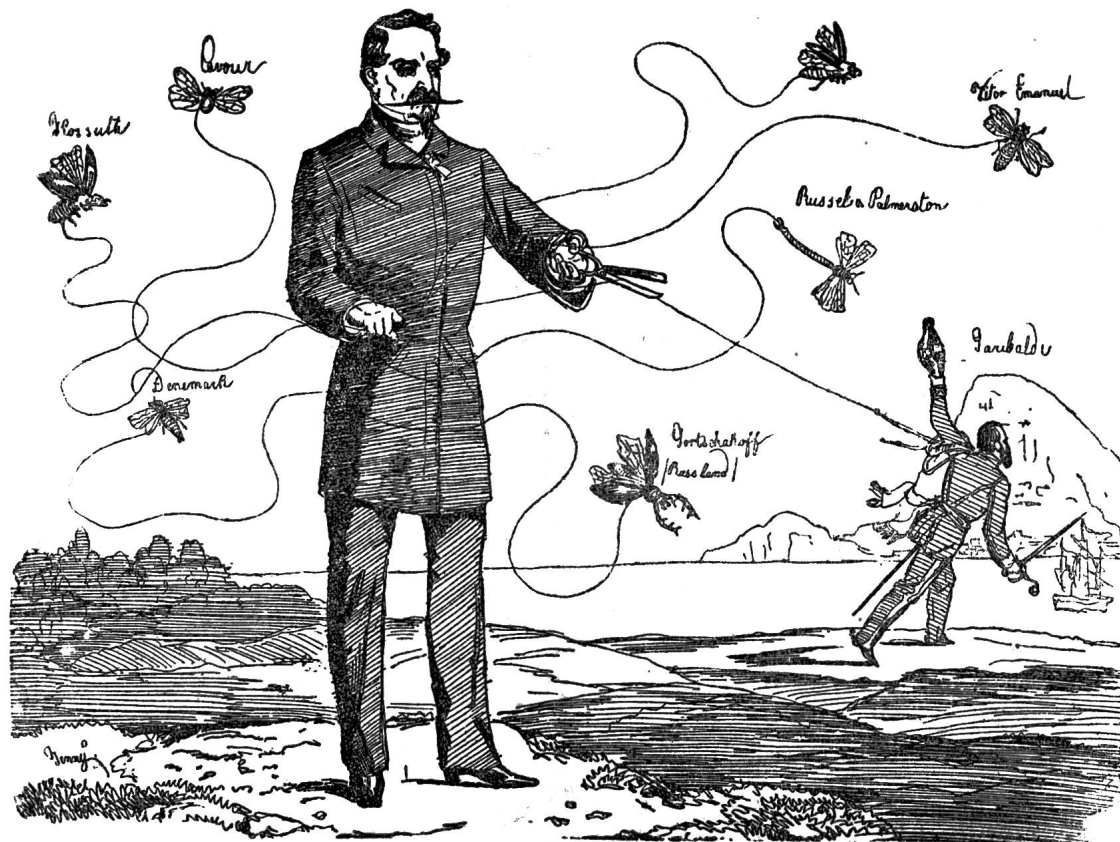
Er hält die Fäden der europäischen Politik in Händen.