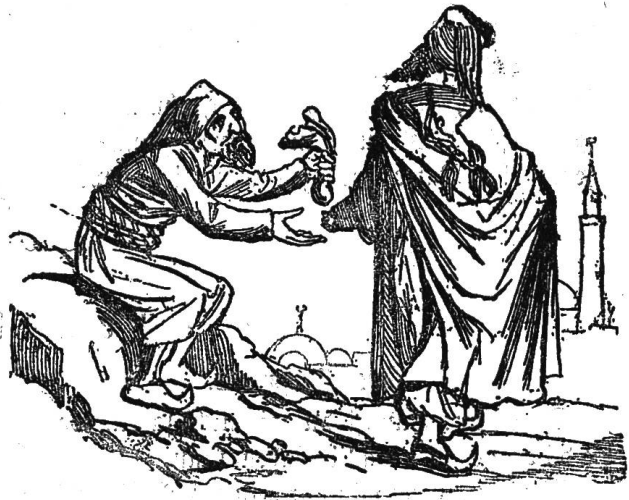
(Der Kaiser wird an dem fernern Genuß seines Lieblingsvergnügens verhindert.)