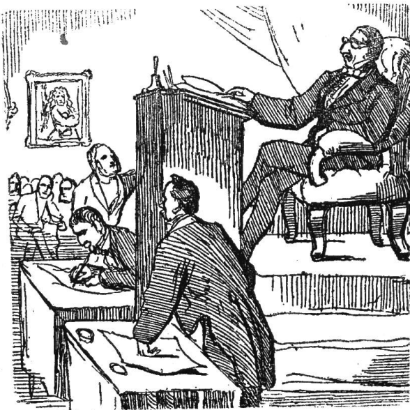
3) Ehre hat mir Macht gegeben.