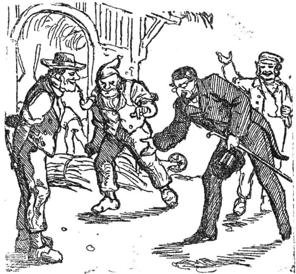
6) Da fand ich die Demuth wieder.