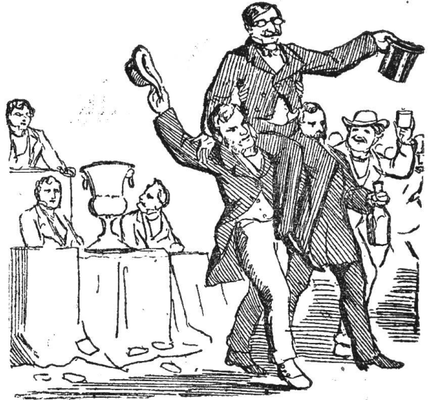
2) Liebe hat mich zu Ehren gebracht.