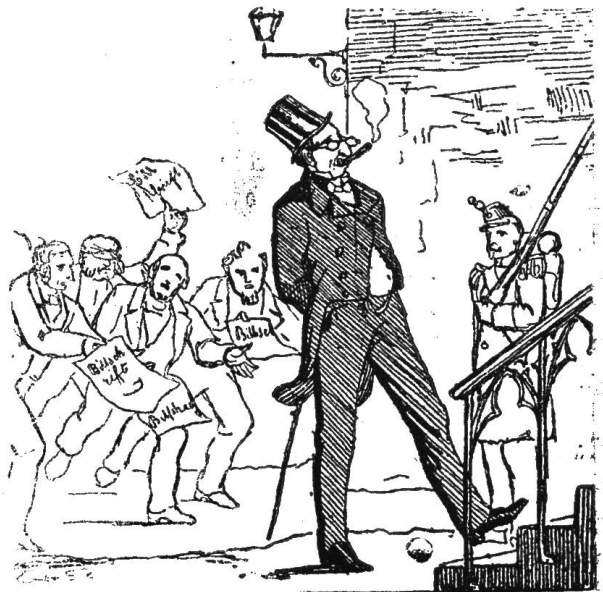
4) Macht ließ mich nach Hoffahrt streben.