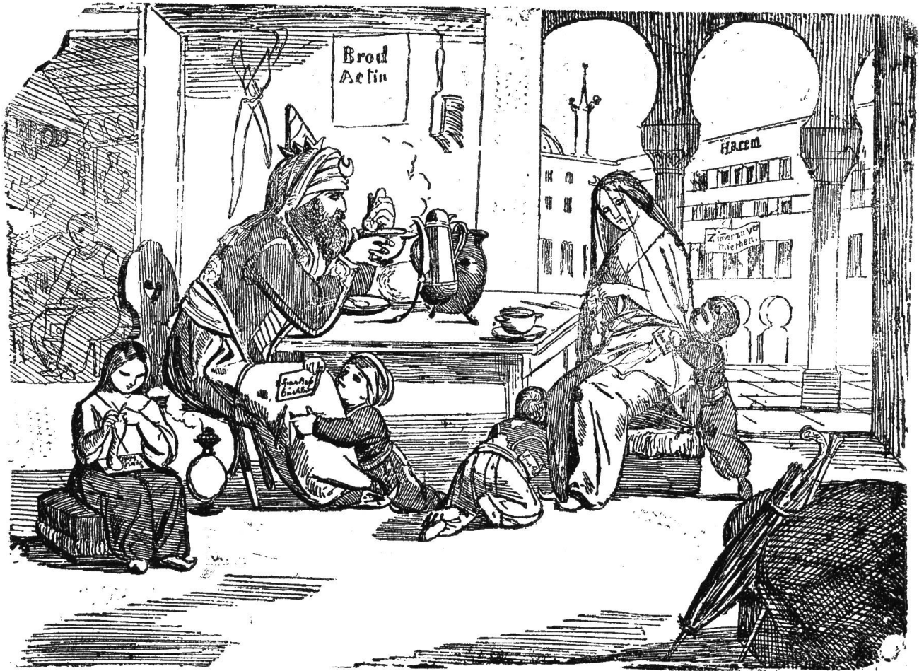
Der Bürger-Padischah und seine Familie.