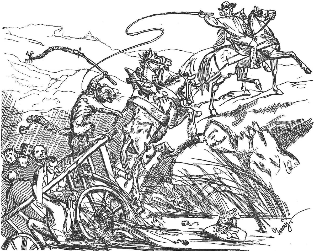
Wie der von Fuhrmann Rolle in den Sumpf gefahrne landschaftliche Staatswagen mittelst eidgenössischen Vorspanns wieder herausgezogen werden muß.