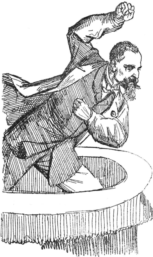
I. Der französische Marktreddner. Orator furibundocharlatan gallicus.