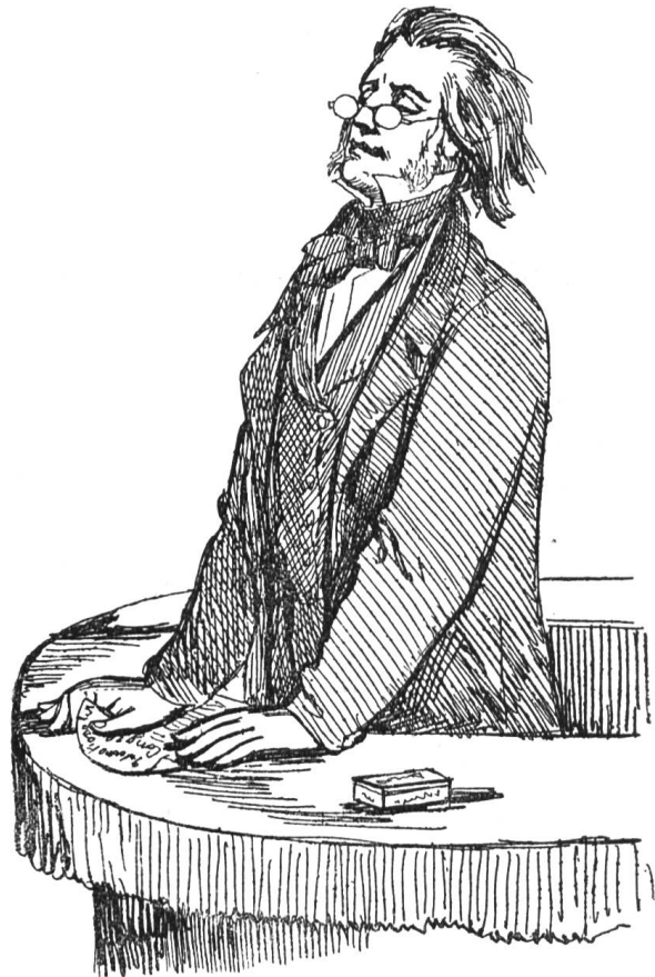
II. Der deutsche Paulskirchenreddner. Orator professorecathedricus. germanicus.