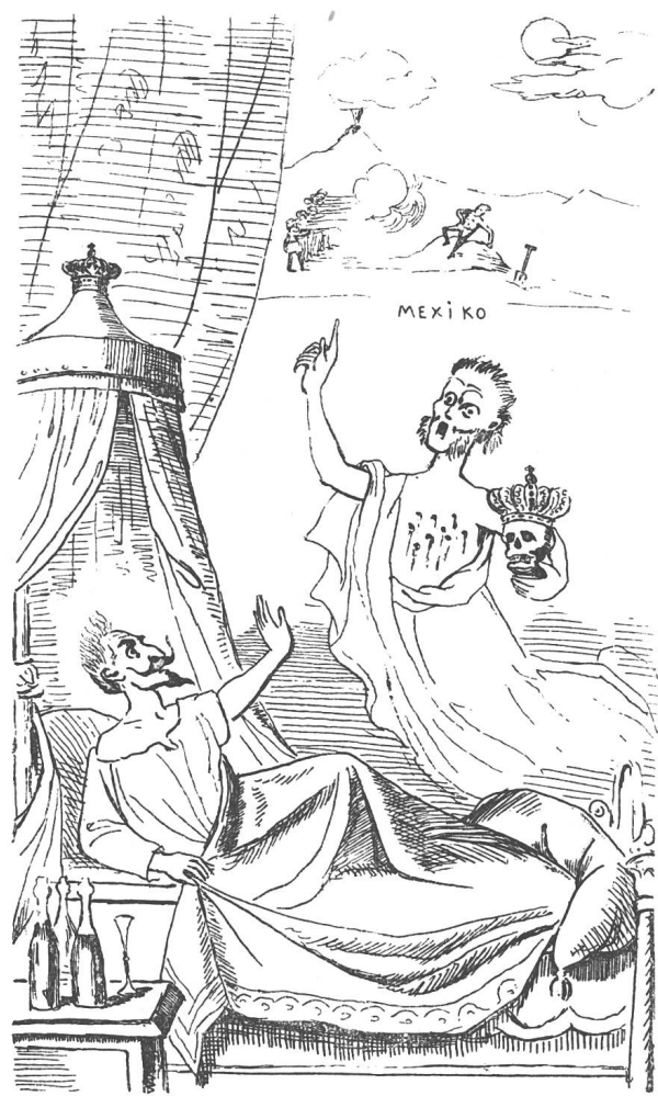
Pariser-Ausstellung bei Nacht.