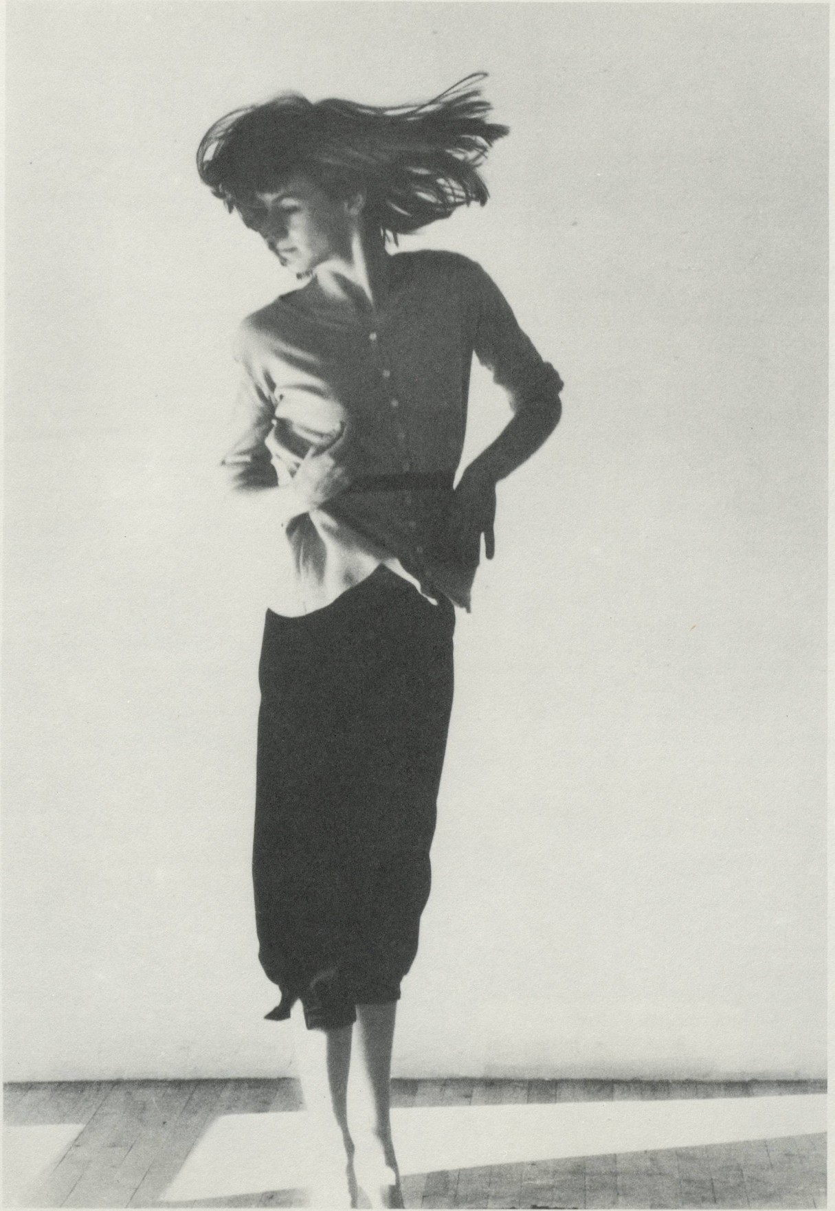
«Journey for Two Sides: A Solo Dance Duets», 1978