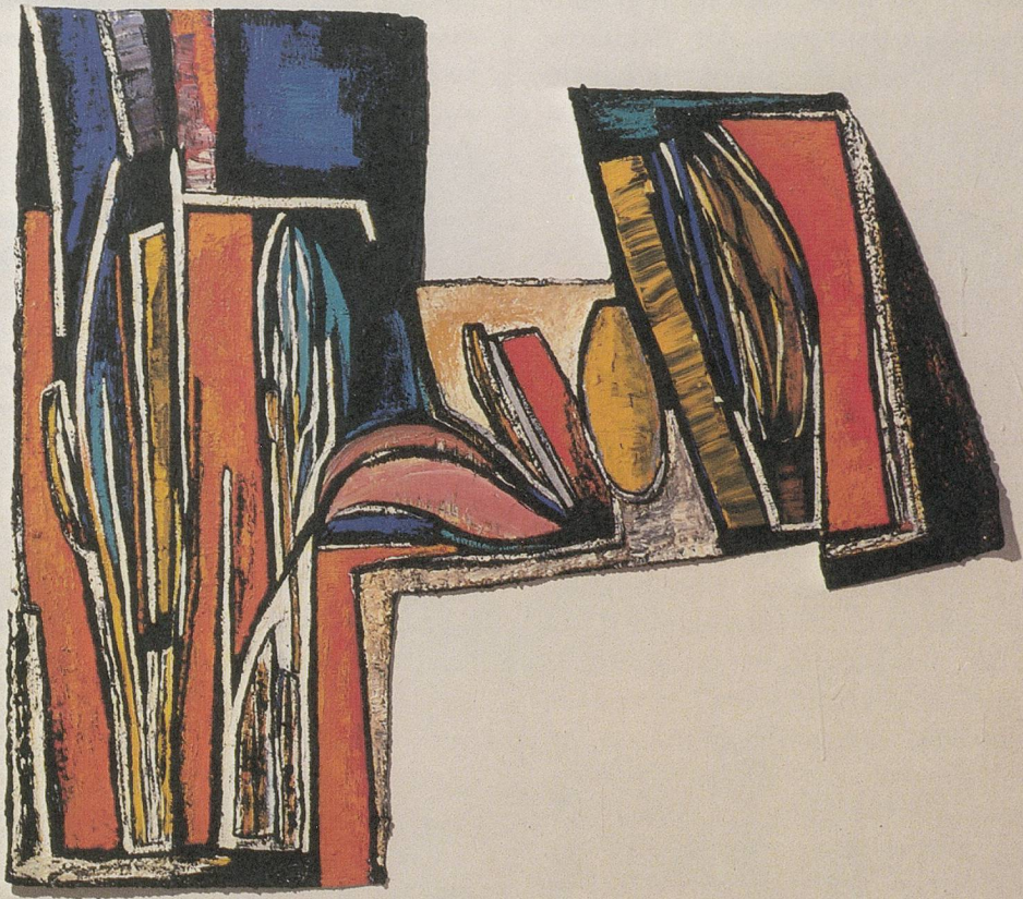
Acryl auf Papier / Acrylic on paper , 1982, 109 × 131 cm