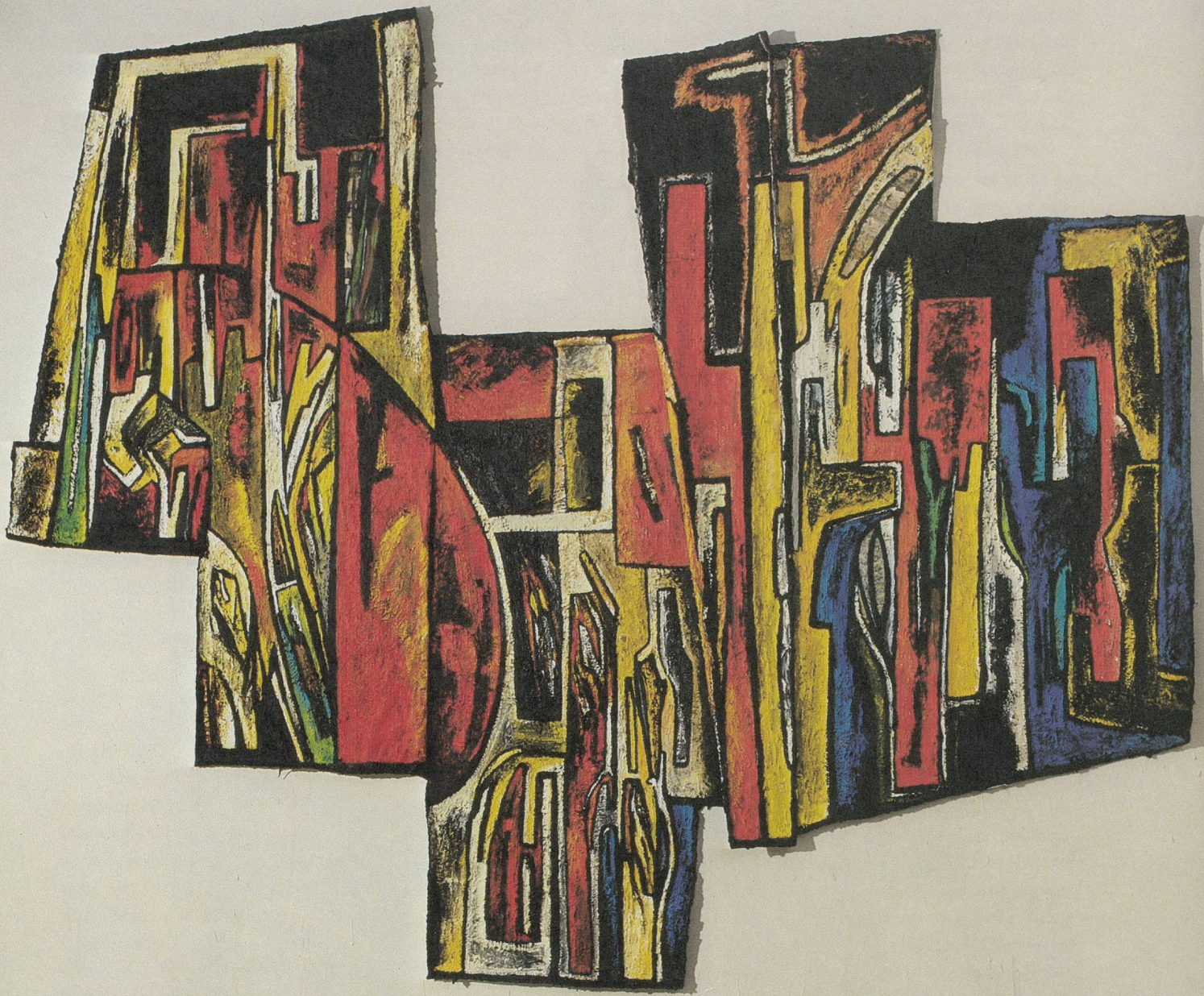
Acryl auf Leinwand / Acrylic on canvas , 1982, 251 × 330 cm