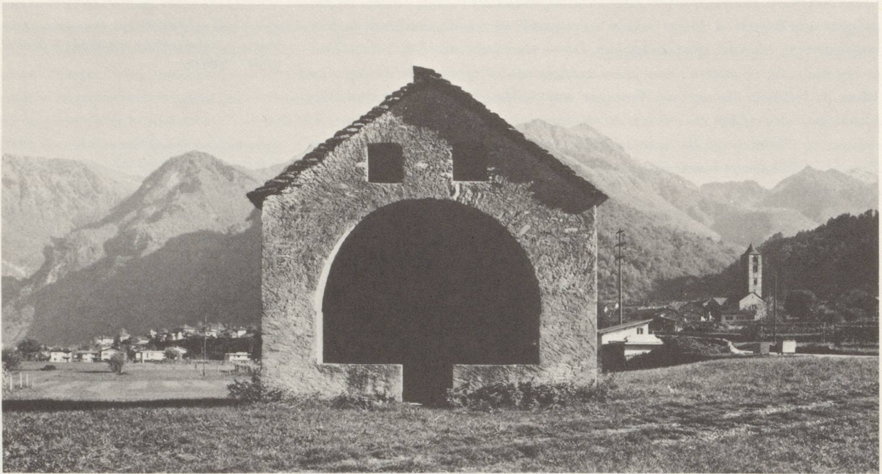
CAPPELLA DI S. MARIA, PALTANO-ROVEREDO (SWITZERLAND), MITTELALTERLICH, UMBAU 1824 / MEDIEVAL, RENOVATION 1824.