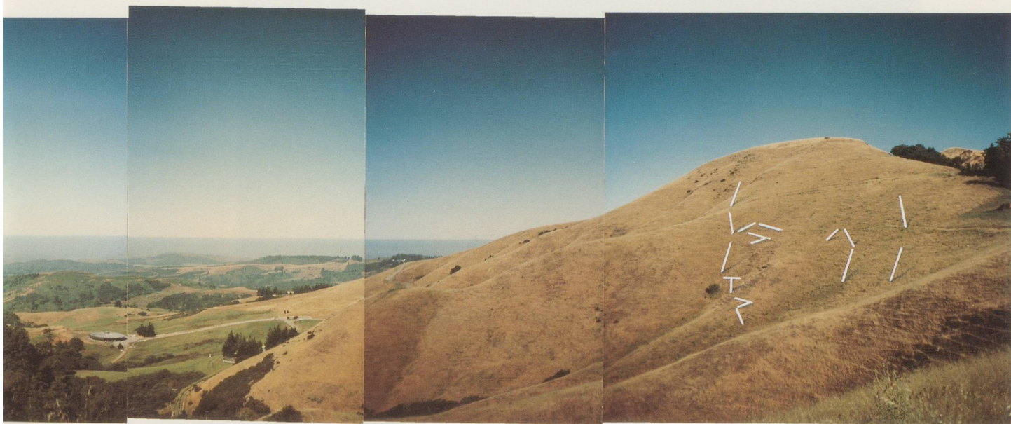
MARKUS RAETZ, PROJEKT FÜR / PROJECT FOR THE DJERASSI FOUNDATION WOODSIDE, CALIFORNIA, 1985/86.

Through this autonomy, the form gives full access, in itself, to a figure that can only have maximum availability. Form and figure are united in the same event. As we have seen above, its ambivalent nature is devoid of secrets and publicity, stripped of riddles as well as solutions, complete in itself, incomplete in us. What makes the head an event lies precisely in this presence that it evokes in ourselves. This visage that is not our own and where, nevertheless, we constantly envisage ourselves. (Translation: Al Goldstein)