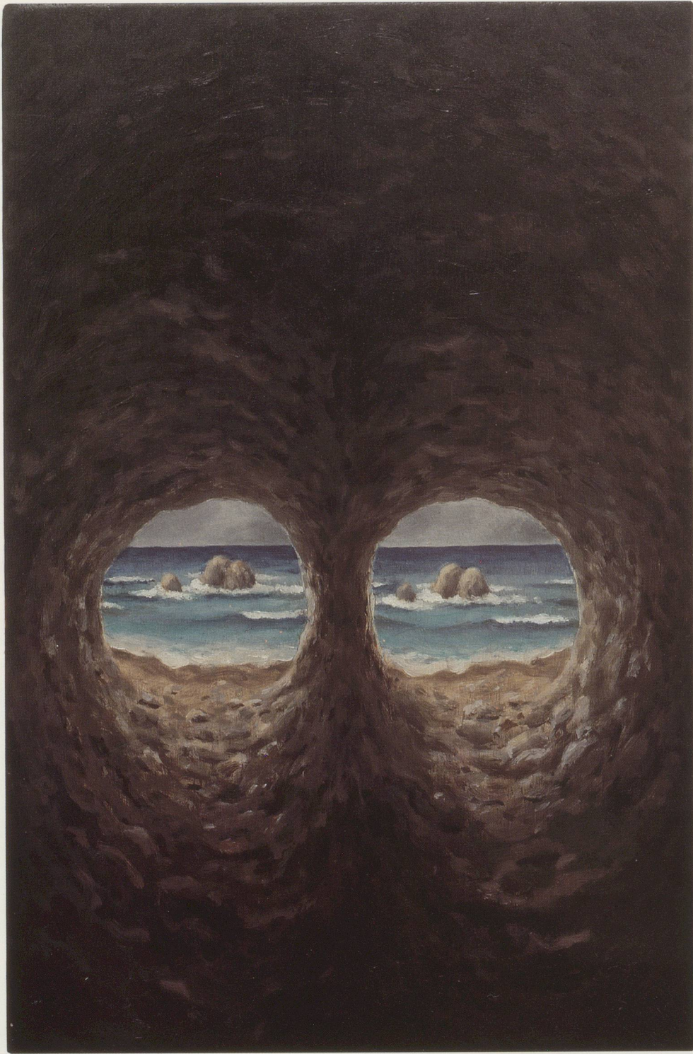
MARKUS RAETZ, SEE-STÜCK / SEA PIECE, 1980-83,

DETAIL AUS DER PERMANENTEN INSTALLATION IM KUNSTMUSEUM BERN, MIXED MEDIA, 24,5 x 56 CM / 9¾ x 22"