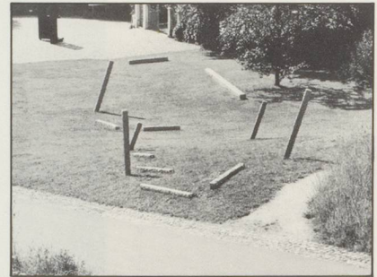
MARKUS RAETZ, KOPF / HEAD, MERIAN PARK BRÜGLINGEN-BASEL, 1984.

dreizehn auf einer Rasenfläche angeordneten Steinquader – teils in die Erde gerammt, in verschiedenen Winkeln geneigt, teils liegend – gehorchen, da keine weiteren Verfahren zur Anwendung gelangen, einer strikten Neutralität, von der man umsonst den leisesten klärenden Hinweis erhofft. Zwar geben die Quader dem Gesicht Konturen, doch dieses löst sie sogleich wieder auf. Paradoxiertweise verankert diese Auflösung der Materie das Gesicht noch stärker in seiner Landschaft: Jede Zurücknahme ist fortan unmöglich.