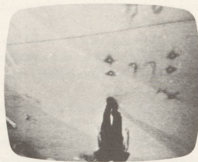
BRUCE NAUMAN, STAMPING IN THE STUDIO / STAMPFEN IM ATELIER, 1968, B/W VIDEO TAPE, 60 MIN., SOUND

BN Die Filme waren im Prinzip dasselbe wie die Videos. Da spielt auch die Verfügbarkeit der Geräte eine Rolle. Als ich in San Francisco lebte, gab es