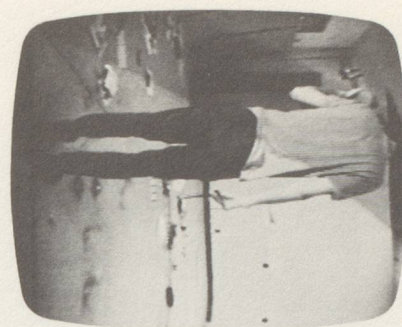
BRUCE NAUMAN, VIOLIN TUNED D,E,A,D / VIOLINE, GESTIMMT D,E,A,D (TOT), 1968, B/W, 60 MIN., SOUND.

BN Für Bahnhöfe bzw. U-Bahnstationen. Innen-aufnahmen von aussen, oder Aufnahmen von Leuten an einer anderen Haltestelle; oder die gleichen Räumlichkeiten, aber andere Leute. Bei manchen Installationen war vorgesehen, um die Ecke zu gehen, so dass man sehen konnte, was sich dort abspielte. Man konnte also zum Beispiel jemanden hinausgehen sehen, aber es war unmöglich, sich selbst beim Betreten oder Verlassen des Raumes zu beobachten.