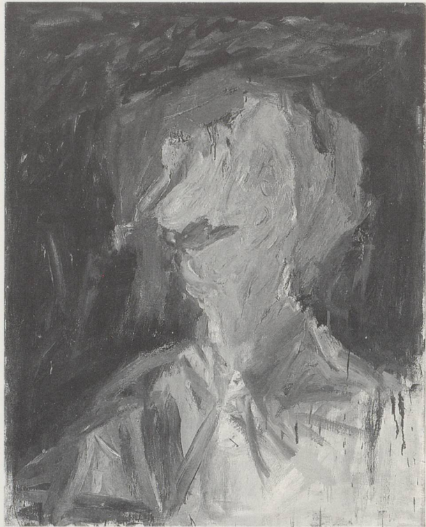
GEORG BASELITZ, PORTRAIT FV. RAYSKI III, X./XI.60, ÖL AUF LEINWAND / OIL ON CANVAS, 100 x 80 CM / 39 1 / 4 " x 31 1 / 2 "

Bei Baselitz' Skulpturen geht es nicht um eine Umkehrung wie in seiner Malerei, sondern um ein Umwandeln der Skulptur zu dem, was diese Umkehrung voraussetzt. Seine Skulptur ist eine ängstliche Abwehr gegen Äusserlichkeit, und mit dieser Abwehr erfindet der Künstler die Objektivität seiner Kunst. Eine wiederholte Haltung des Manifestes: Georg Baselitz. (Übersetzung: Mariette Müller)