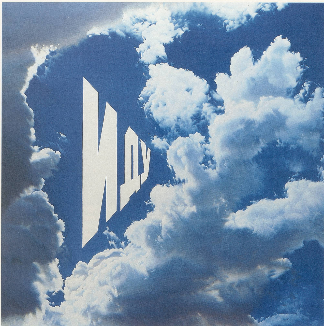
ERIK BULATOW, ICH GEHE / I AM GOING , 1975, ÖL AUF LEINWAND / OIL ON CANVAS , 220 x 220 cm / 86 \frac{2}{3} x 86 \frac{2}{3} ".