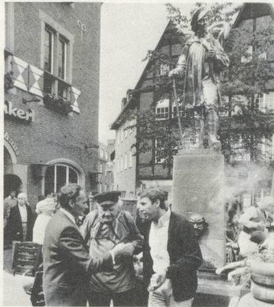
JEFF KOONS, REPLIK DES «KIEPENKERLS» IN ROST- FREIEM STAHL / REPLICA OF THE "KIEPENKERL" IN STAINLESS STEEL, 1987 IN MÜNSTER.

practical basis using the city of Münster as an example and involving exemplary cooperation between artists, the authorities and inhabitants. Furthermore, this was an issue which the city and communal authorities, together with all their committees, had been struggling with fruitlessly for decades. Suddenly new light was thrown on the tiresome theme "Art for public buildings" and