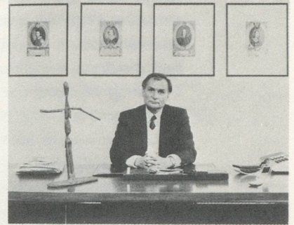
A. R. PENCK, SKULPTUR AUF DEM TISCH DES OBERBÜRGERMEISTERS / SCULPTURE ON THE MAYOR'S DESK, 1986/87 IN MÜNSTER.

the random placement of sculptures in public squares. I sincerely hope that the authorities do more than simply take note of the exhibition. The catalogue has become an excellent handbook, rich in new ideas.