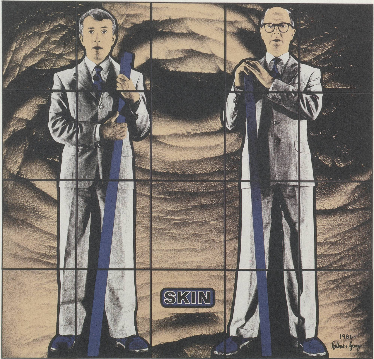
GILBERT & GEORGE, SKIN / HAUT, 1986,