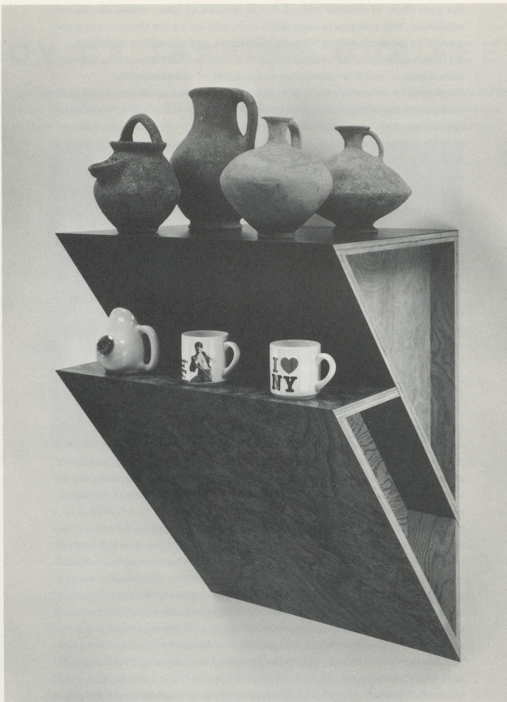
HAIM STEINBACH, UNTITLED (JUGS, MUGS) # 1 / OHNE TITEL (KRÜGE, BECHER) # 1 , 1987, MIXED MEDIA CONSTRUCTION , 43 \frac{3}{4} x 23 \frac{3}{4} x 19" / 111,1 x 60,3 x 48,3 cm