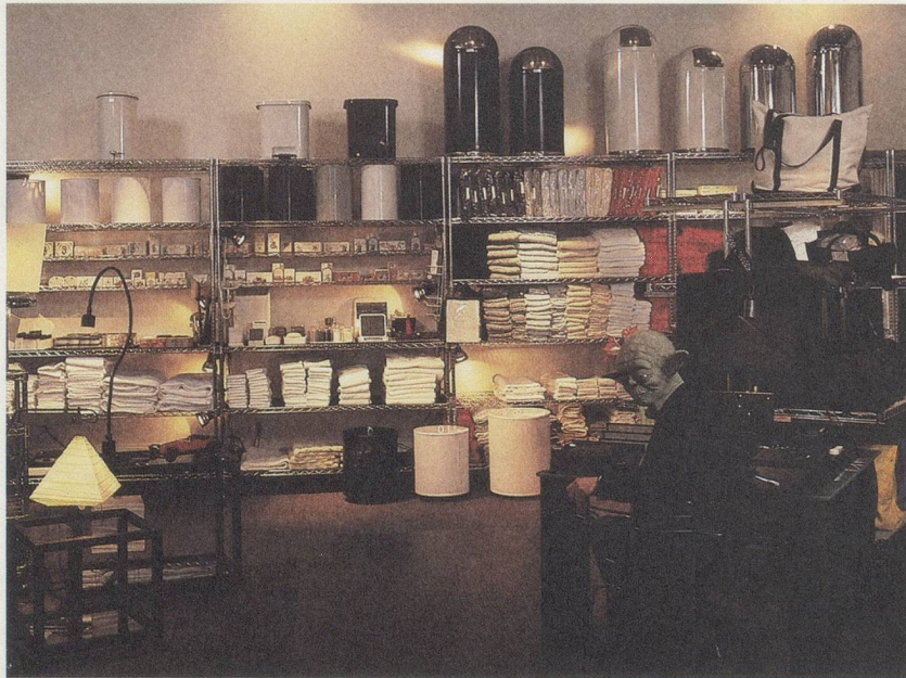
HAIM STEINBACH 1987 AT D.F. SAUNDERS ON WESTBROADWAY /

“A pornography of all functions and objects in their readability, their fluidity, their availability, in their forced signification, in their performativity, in their branching, in their polyvalence, in their free expression.” Jean Baudrillard, THE ECSTASY OF COMMUNICATION