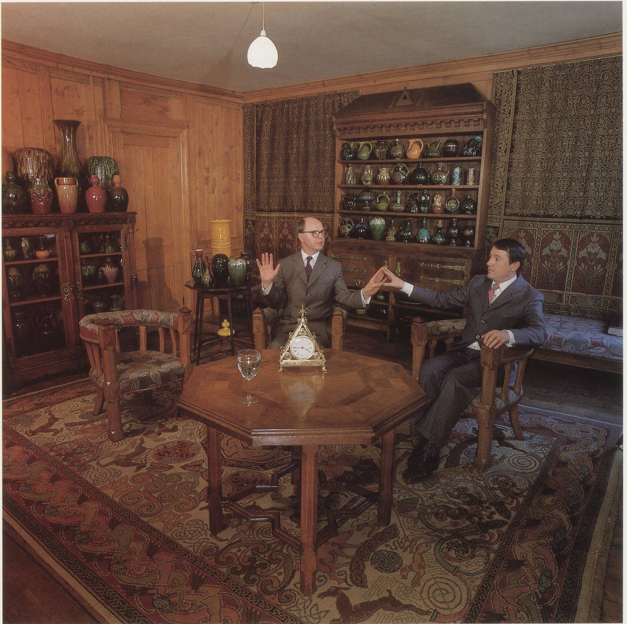
PORTRAIT OF GILBERT & GEORGE FOR THE OBSERVER MAGAZINE, 1984.