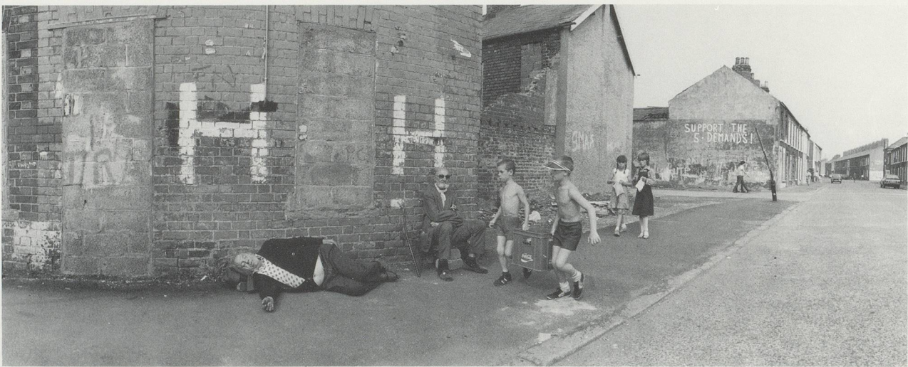
SHORT STRAND, SUMMER / SOMMER, BELFAST 1984