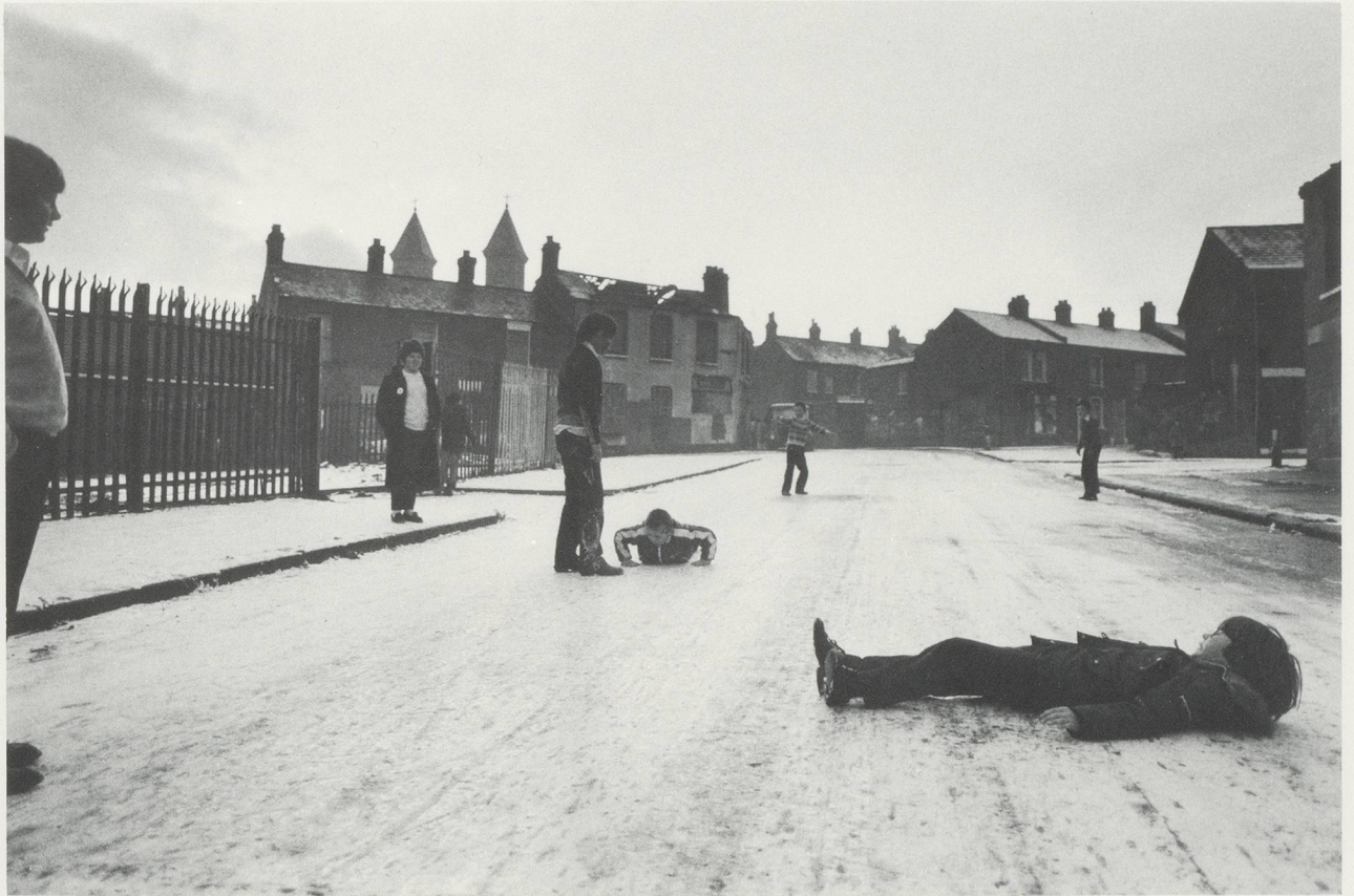
THE FIRST SNOW / DER ERSTE SCHNEE, ARDOINE, BELFAST, 1981

the very depiction of space is inevitably caught up in politics.