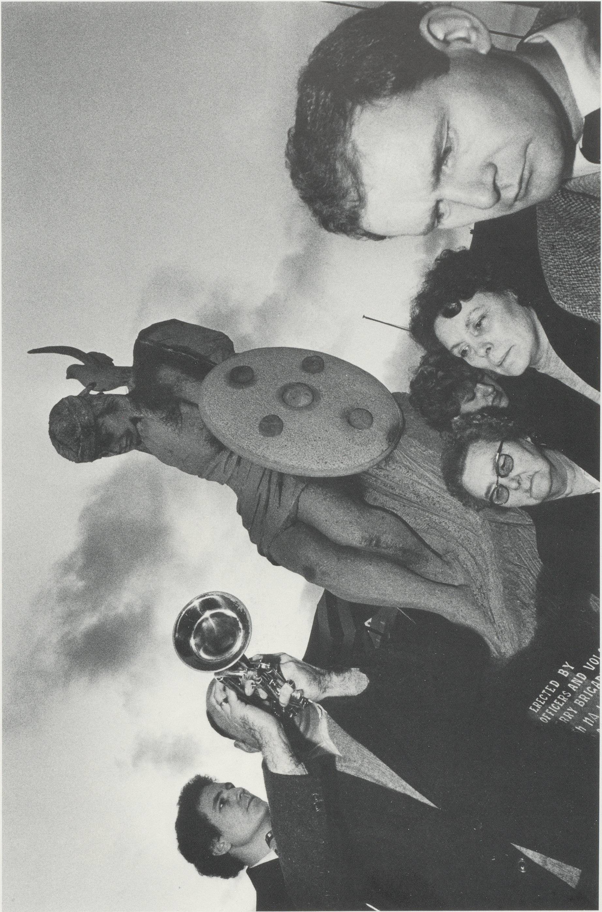
ERECTED BY OFFICERS AND VOL UNRY BRIGAD h NA