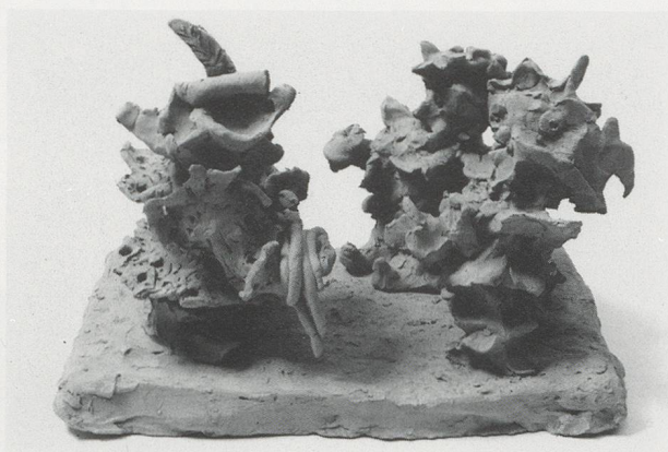
MARCO POLO ZEIGT DEN ITALIENERN ZUM ERSTEN MAL DIE AUS CHINA MITGEBRACHTEN SPAGHETTI / MARCO POLO SHOWS THE ITALIANS SPAGHETTI, BROUGHT BACK FROM CHINA, FOR THE FIRST TIME.

MICK JAGGER UND BRIAN JONES BEFRIEDIGT AUF DEM HEIMWEG, NACHDEM SIE I CAN'T GET NO SATISFACTION KOMPONIERT HABEN / MICK JAGGER AND BRIAN JONES GOING HOME SATISFIED AFTER COMPOSING I CAN'T GET NO SATISFACTION.