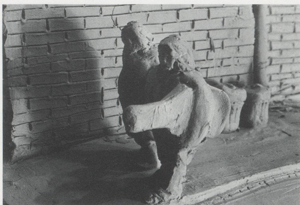
PETER FISCHLI/DAVID WEISS,

MICK JAGGER UND BRIAN JONES BEFRIEDIGT AUF DEM HEIMWEG, NACHDEM SIE I CAN'T GET NO SATISFACTION KOMPONIERT HABEN / MICK JAGGER AND BRIAN JONES GOING HOME SATISFIED AFTER COMPOSING I CAN'T GET NO SATISFACTION.