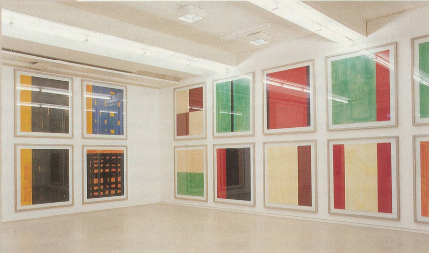
AUSSTELLUNG / EXHIBITION GÜNTHER FÖRG, MUSEUM FRIDERICIANUM KASSEL, 7. 10. -16. 12. 1990.