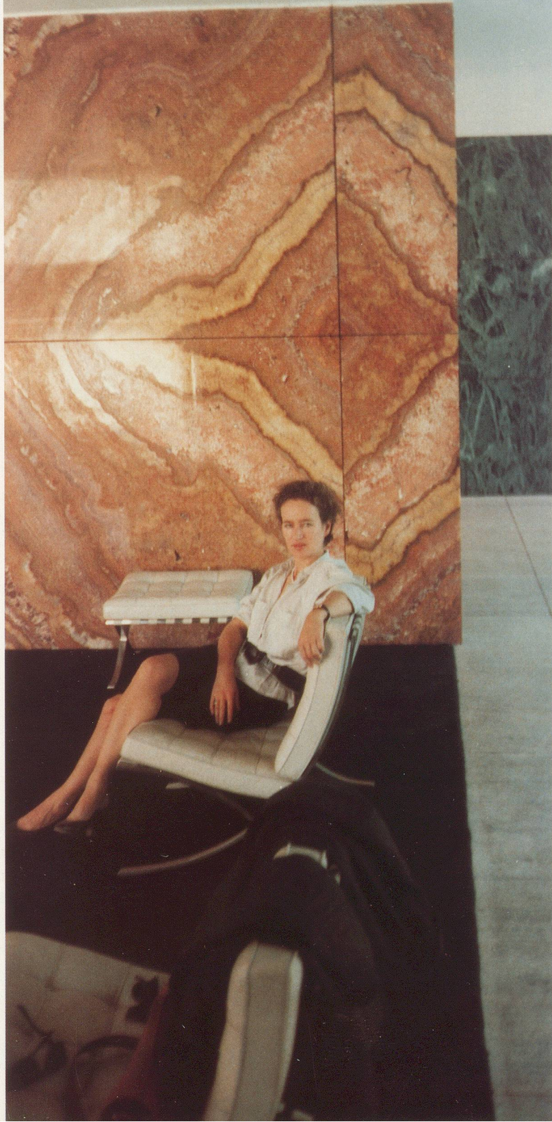
GÜNTHER FÖRG, BARCELONA PAVILLON, 1988, color photograph, 270 x 120 cm / 106 x 47"