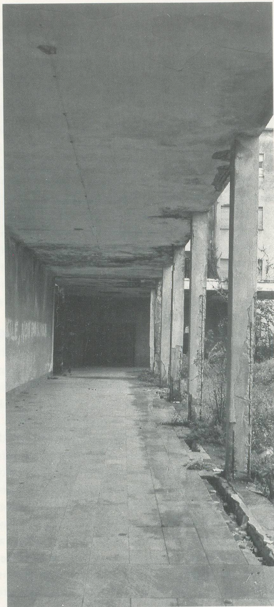
GÜNTHER FÖRG, COLONIA «28 OTTOBRE», MARINA DI MASSA, 1986,

Schwarz/Weiss-Photographie, je 270 x 120 cm / 106 1 / 4 x 47 1 / 4 '' each.