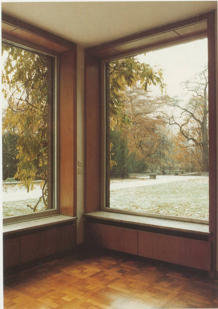
GÜNTHER FÖRG, HAUS LANGE, KREFELD, 1985, Farbphotographie, 270 x 180 cm / colorphotograph 106 1 / 4 x 70 7 / 8 "