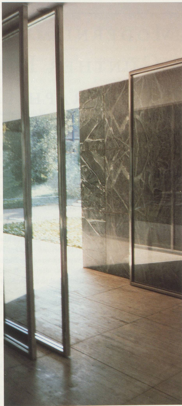
GÜNTHER FÖRG, BARCELONA PAVILLON, 1988, color photograph, 270 x 120 cm / 106 x 47".