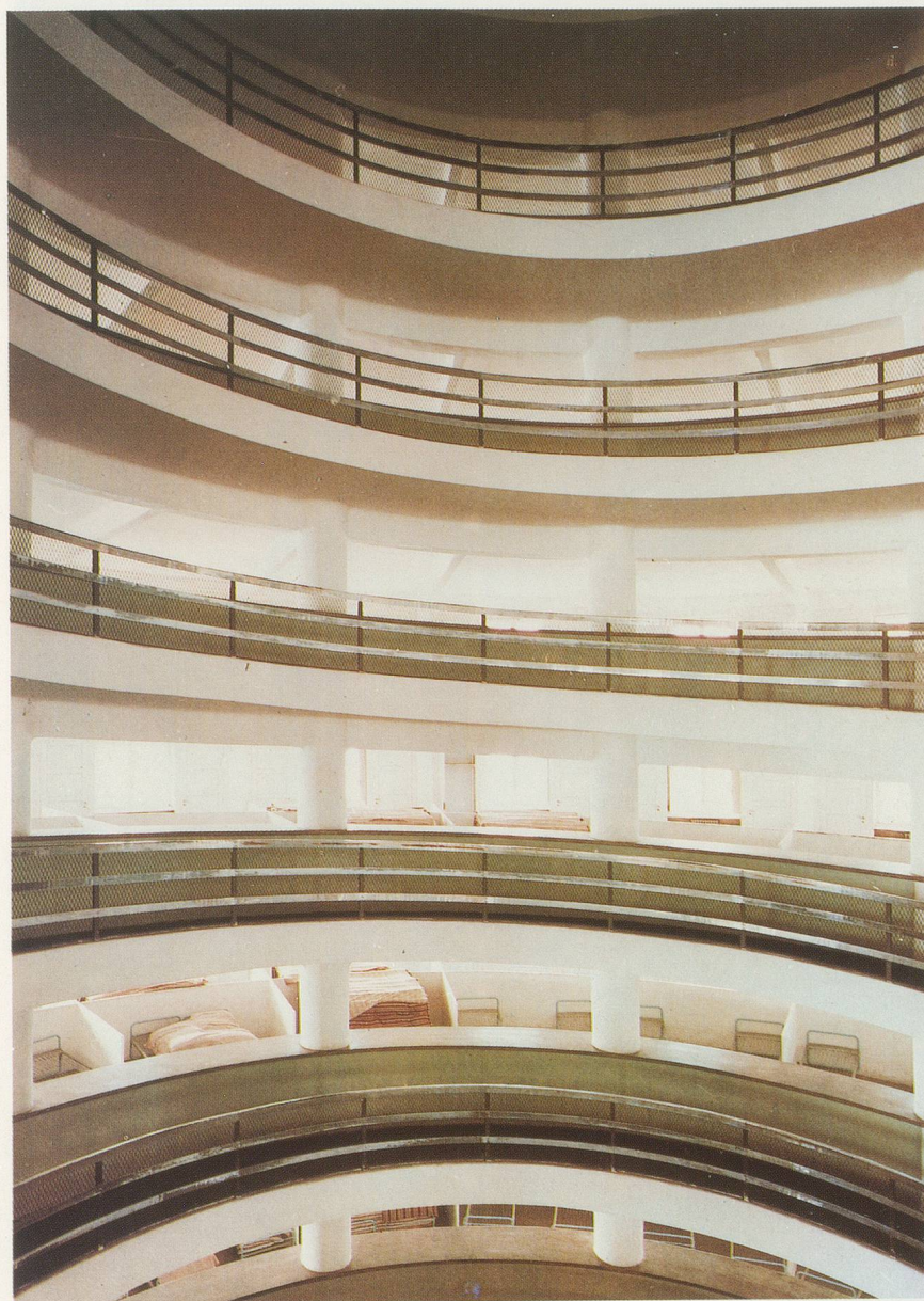
GÜNTHERFÖRG, KINDERHEIM, TURIN, 1986,

Farbphotographie, 270 x 180 cm / CHILDREN'S HOME, TORINO, 1986, colorphotograph, 106 1 / 4 x 70 7 / 8 "