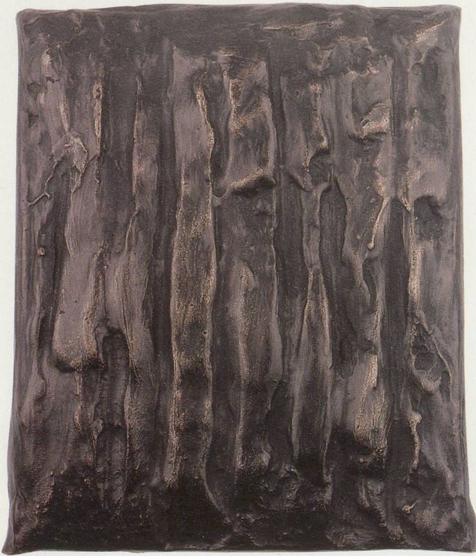
Günther Förg, Bronze Relief Nr. 2

Edition für PARKETT, 25,5 x 21 x 3,5 cm, Auflage: 20 Ex.,/