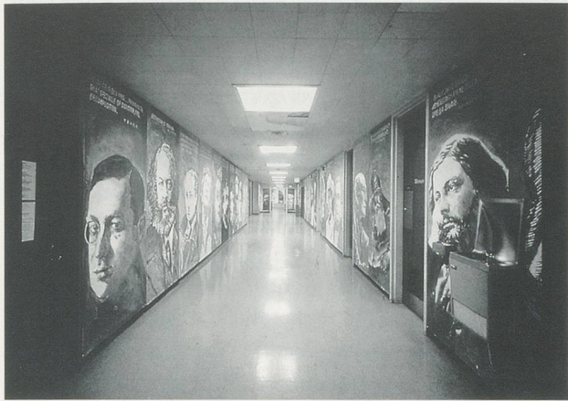
MIKE KELLEY, PAY FOR YOUR PLEASURE / BEZAHL FÜR DEIN VERGNÜGEN , 1988, INSTALLATION VIEW: RENAISSANCE SOCIETY CHICAGO.

Soldatenethos dazu anstachelt. Eher dreht sich's bei Mike Kelley um eine gewisse Hobo-Schläue, dass die zum Scheitern verurteilten Geschichten in den Nischen nicht immer scheitern: das grössere Elend der nur von Erkenntnissen Abhängigen gegenüber denen, die sich auch auf Erfahrungen berufen können (und deren Geschichte: in einem Artikel über die SRL (Survival Research Laboratory), den er vor einiger Zeit für Parkett Nr. 21 schrieb, erwähnte er unter anderem auch Robert Smithson als Anhänger