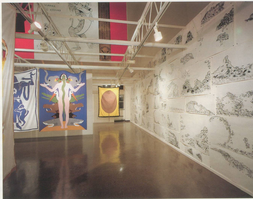
MIKE KELLEY, INSTALLATION VIEW, RENAISSANCE SOCIETY, 1988, CHICAGO.