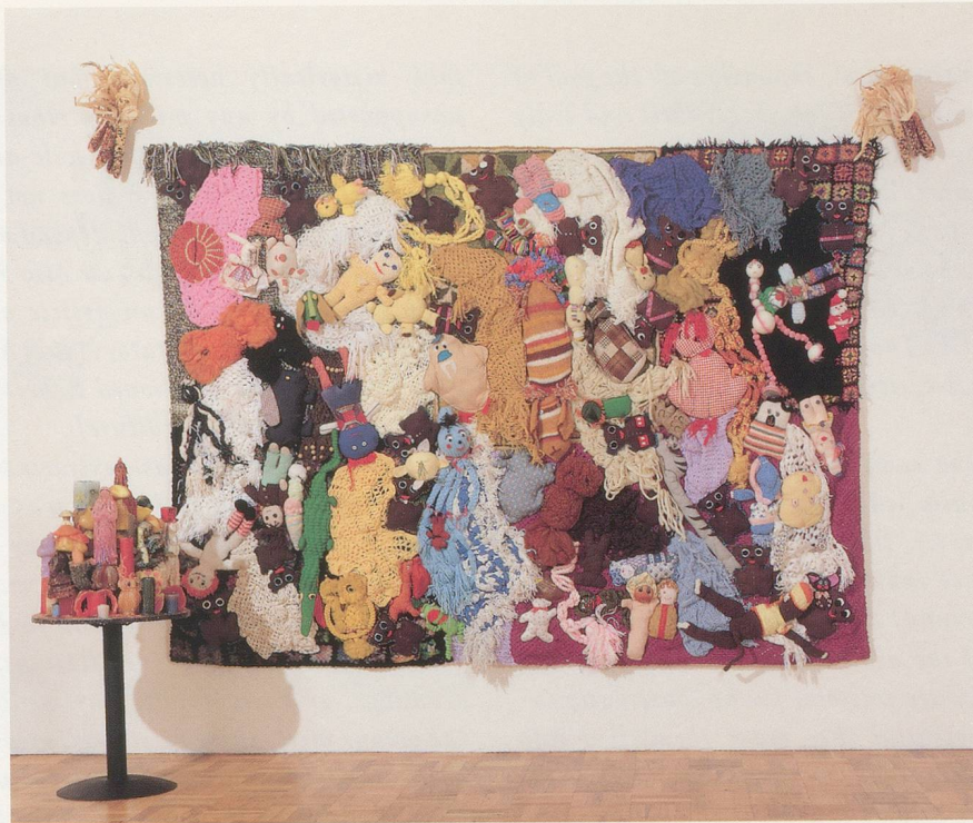
MIKE KELLEY, MORE LOVE HOURS THAN CAN EVER BE REPAID / MEHR LIEBESSTUNDEN ALS JE ZURÜCKBEZAHLT WERDEN KÖNNEN, 1978, MIXED MEDIA, 96 x 127 x 6 "/244 x 323 x 15 cm. UND / AND: THE WAGES OF SIN / DER LOHN DER SÜNDE, 1987, WAX CANDLES ON ROUND BASE / WACHSKERZEN AUF RUNDEM GESTELL.