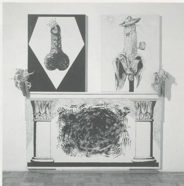
MIKE KELLEY, PAGAN ALTAR/HEIDNISCHER ALTAR, 1989, ACRYLIC ON THREE PANELS WITH 2 BOARDS AND 2 BUNCHES OF DRIED CORN/ACRYL AUF 3 FELDERN MIT 2 TAFELN UND 2 BÜSCHELN GETROCKNETEN MAIS,

Das darf ein Künstler wieder mal nicht sagen: Pornos, Arschwitze, Scheisse, Schmutz – so dass Kelley damit definitiv ein Potential gewonnen hat. In einer etwas eleganteren Form war auch die Arbeit mit