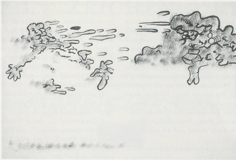
MIKE KELLEY, GARBAGE DRAWING / ABFALL-ZEICHNUNG NO. 52, 1989, ACRYLIC ON PAPER / ACRYL AUF PAPIER, 30 1/2 x 42" / 77,5 x 106,7 cm.

lation in Chicago, incorporating commissioned portraits of famous writers and artists, alongside the serial killer picture, POGO THE CLOWN, a collection box, HALFA MAN, and the installation, PAY FOR YOUR PLEASURE), art by and with women (HOW I GOT INTO ART, with vaseline-blurred nude shots of women working on art/in performance), hobby art (MORE LOVE HOURS THAN CAN EVER BE REPAID and WAGES OF SIN), religious art (banners), sex (INCORRECT SEXUAL MODELS, drawings), comic book figures (SAD SACK), the music scene (flag series). Whether parody of the idea of a pantheon, thematic use of the relationship with woman as artist, crime and punishment, eternal nonachievement, or headbanging... everyone and everything is defined by mass culture.