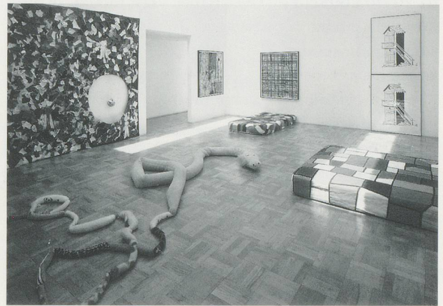
MIKE KELLEY, INSTALLATION VIEW , ROSAMUND FELSEN GALLERY, 1989, LOS ANGELES.

Formenwahn. Alles muss erklärbar sein und visuell lesbar. Jedem seiner «Projekte», die er einfach alle «Bilder» nennt, selbst die, in denen wirklich ultimativ elende, miserable, traurige, eklige, aber auch mythenbildende Reste von Kultur verwendet wurden, liegt eine schulmeisterliche Logistik und wohlrecherchiertes Studienmaterial zugrunde. Die eigene Affinität zum Schrabbel wird so ausgenüchert und als Code verwendbar gemacht. B-B-Bildung. Er sucht die Zeitlosigkeit von Verrottetem,