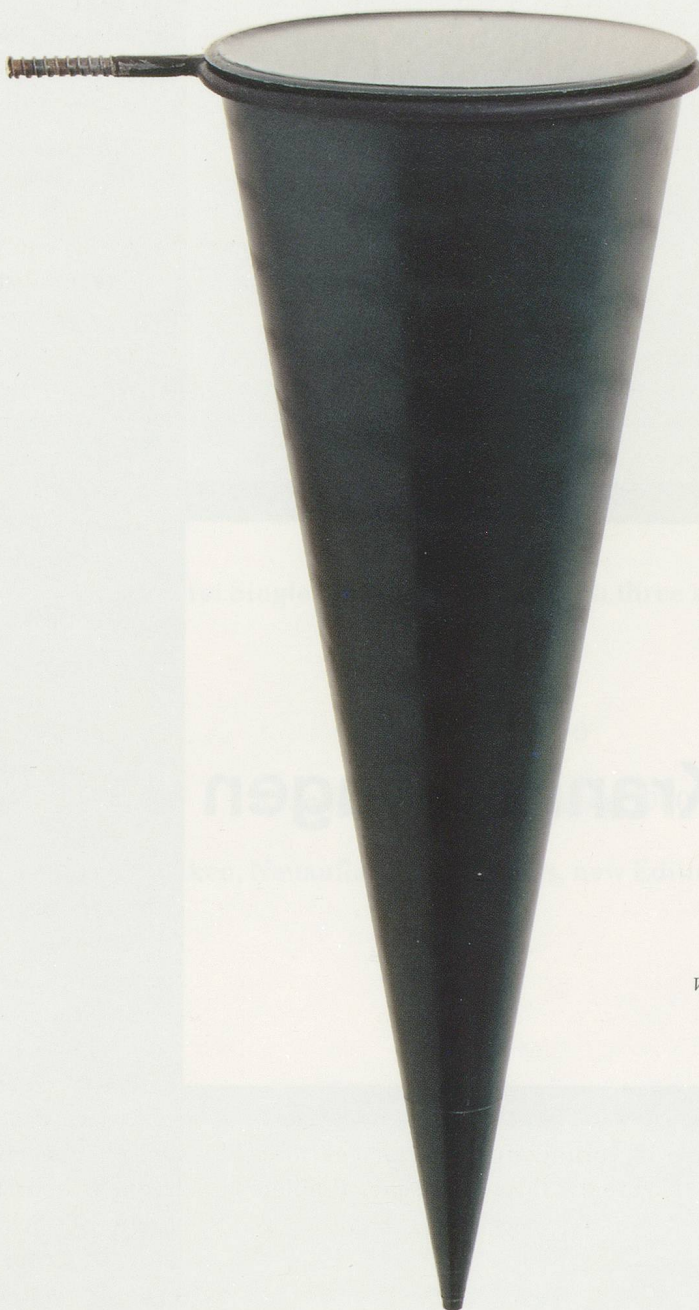
KATHARINA FRITSCH, VASE, 1980, Kunststoff, Wasser, 15 x 10 x 28 cm/ VASE, synthetic material, water, 5 15 / 16 x 3 15 / 16 x 11"

mässig zu spüren scheint). Genau an diesem Punkt wird Fritschs Interesse an einer Entspezialisierung der Arbeit des Künstlers für ihr Unternehmen entscheidend. Obschon man ihre Werke zunächst nicht für kompromisslos hält, wäre Fritsch mit dieser Beurteilung sicher nicht einverstanden. Eine Revolution