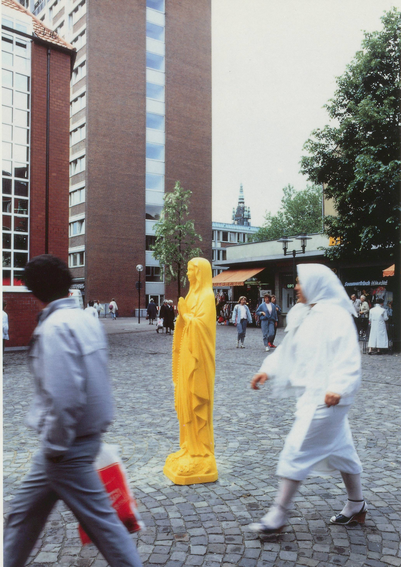
KATHARINA FRITSCH, DIE GELBE MADONNA, 1987/THE YELLOW MADONNA, (INSTALLATION IN MÜNSTER 1987)