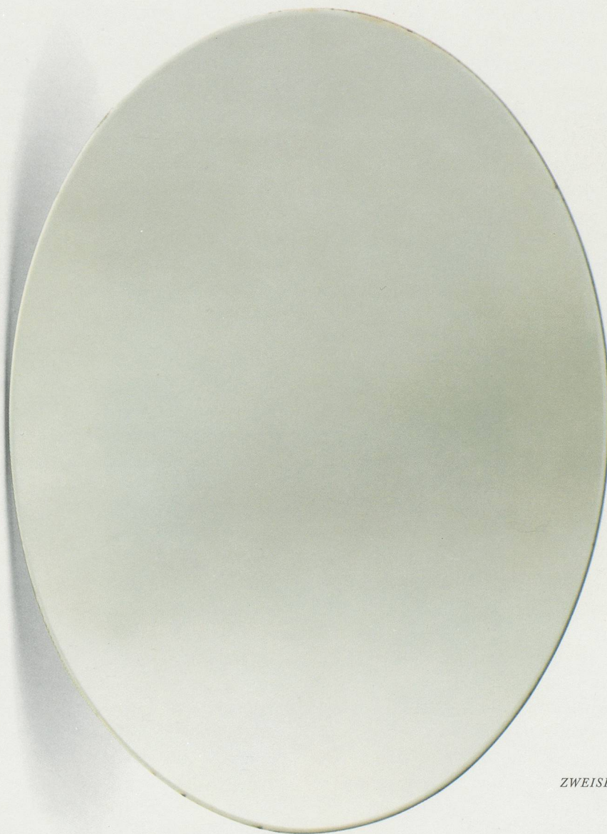
KATHARINA FRITSCH, ZWEISEITIGER SPIEGEL, 1981, 20 x 15 x 4 cm/ TWO-SIDED MIRROR, 7 3 / 4 x 5 15 / 16 x 1 5 / 8 ”

Madonna nicht einfach «gefunden»; doch ebensowenig hat die Künstlerin sie «geschaffen». Vielmehr war Fritsch davon überzeugt, dass diese spezielle Form der geeignetste kulturelle Träger für die Gedanken und Gefühle war, die ausgedrückt werden sollten, und dass sie deshalb die erhöhte Aufmerksamkeit – ihre Nachbildung und neues Kolorit – verdient. Wie