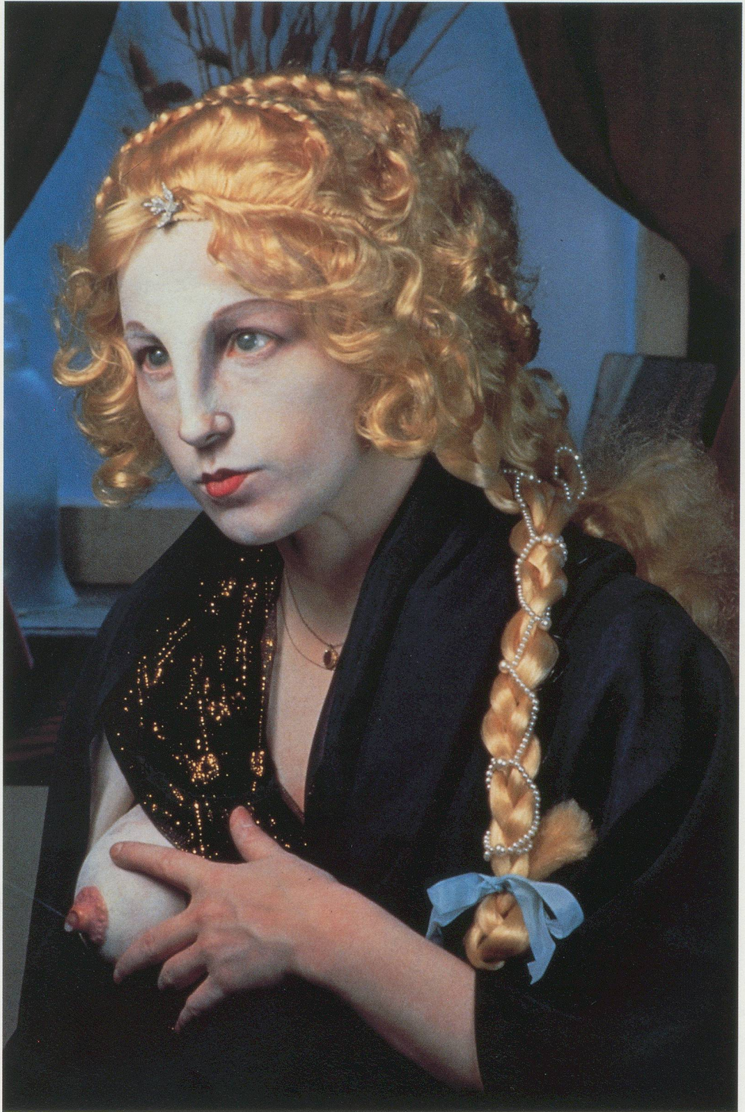
CINDY SHERMAN, UNTITLED # 225, 1990, color photo, 48 x 33"/OHNE TITEL NR. 225, 1990, Farbphoto, 122 x 83,8 cm.