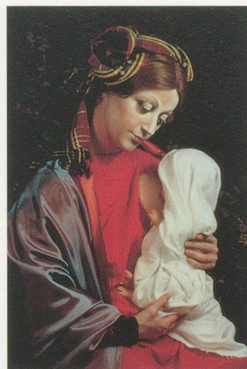
CINDY SHERMAN, UNTITLED # 223, 1990, color photo, 58 x 42"/OHNE TITEL NR. 223, 1990, Farbphoto, 147,3 x 106,6 cm.

female gestation seems to “cow” the woman’s gaze. Her consciousness? Somewhere in the sphere between innocence and immanence. Sherman’s