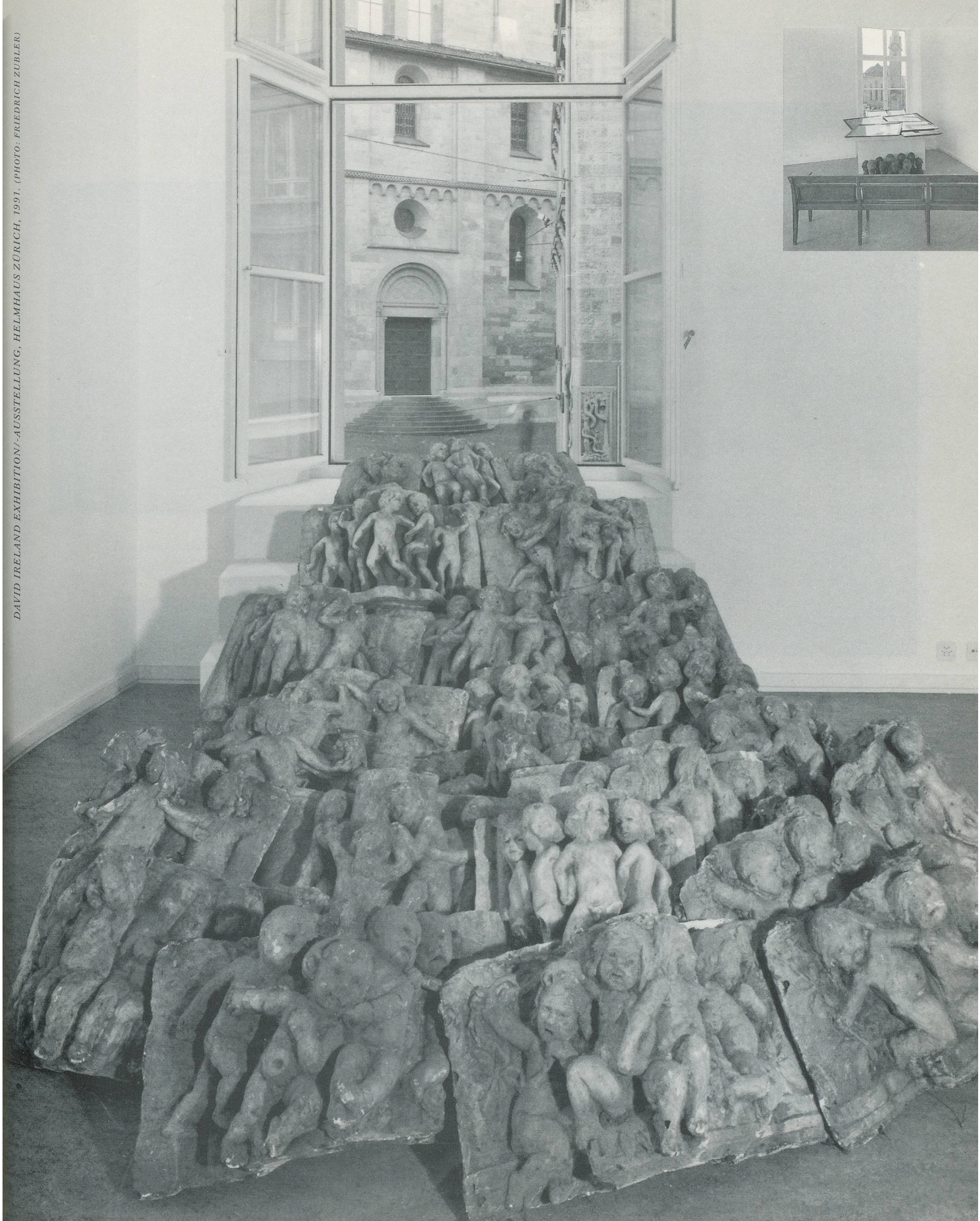
DAVID IRELAND EXHIBITION/AUSSTELLUNG, HELMHAUS ZÜRICH, 1991.