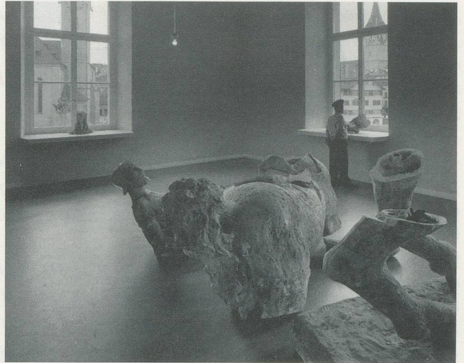
Transport der Ausstellungsstücke von den über die Stadt verstreuten Lagerräumen zum Helmhaus Zürich in die DAVID IRELAND-AUSSTELLUNG/ Transport of exhibition materials from storage spaces all across the city to the DAVID IRELAND EXHIBITION at the Helmhaus Zürich.