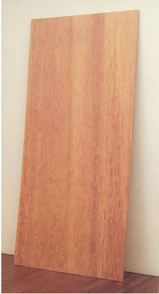
LINSELEIT, ROBERT GOBER, SPERRHOLZ, 1982, fermentos Bananwäskel , 242 x 118 x 1,6 cm (PFL/WOOD, 1987, Immunisat für 350 x 400 x 1/4" , PHOTO CLOPPREK CLIMONSD) RECHTS/RICHT, LOUISE JOUJOUROUS, CELL ZELLE, mixed media, 1991.