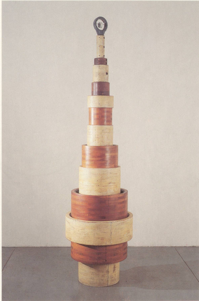
El Faro , 1989. Wood and steel, 90½ × 25½ × 25½ in. (230 × 65 × 65 cm.)

SPERONE WESTWATER 121 Greene Street New York 10012 212 431-3685 (fax) 941-1030