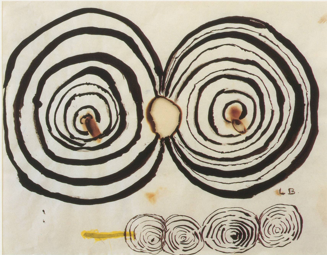
LOUISE BOURGEOIS, UNTITLED, 1989,

ink and charcoal on burnt paper, 8 1/2 x 11" / OHNE TITEL, 1989, Tusche und Kohle auf angesengtem Papier, 21,5 x 28 cm.