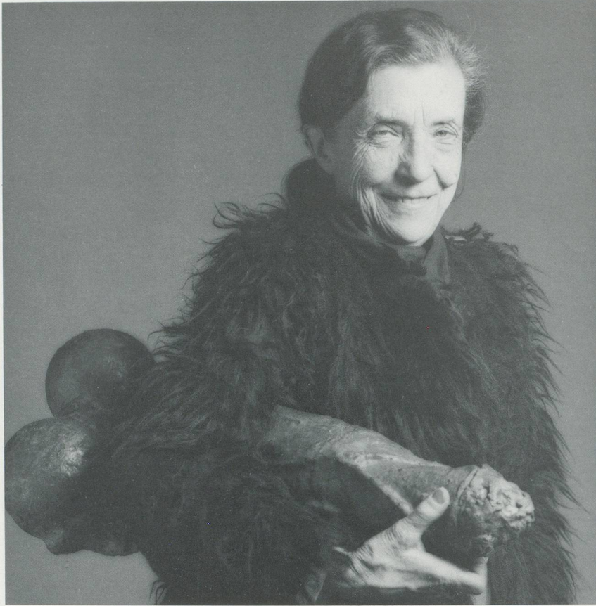
ROBERT MAPPLETHORPE, LOUISE BOURGEOIS, 1982.

She grins, subversively. Pressing the object close against her side as if it were something else, some ordinary thing to tote around in this way, like a folded newspaper, an umbrella, a walking stick or, alternatively, a purse or a pet, Louise Bourgeois grips instead her sculpture, FILLETTE. Fillette, meaning in French “little girl”, is a two foot long latex phallus that Bourgeois describes as a doll, her doll. 1 Dressed in a monkey fur coat, she clasps the sculpture’s shaft with her arm so that the two large balls nestle securely behind her elbow while thumb and forefinger firmly grasp the tip. The roughened skin of the tip emerges from the V-shaped opening of a sort of