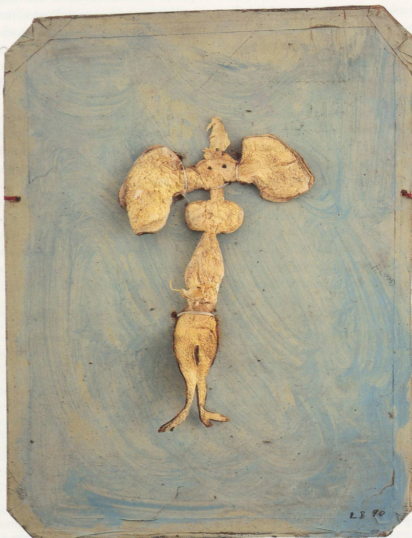
LOUISE BOURGEOIS, ORANGE EPISODE, 1990 oil, gouache and orange, collage on board, 17 x 13 1/8 "/43 x 33 cm.