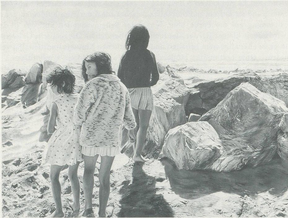
FRANZ GERTSCH, SAINTES-MARIES-DE-LA-MER II, 1971,

Acryl auf ungrundierter Baumwolle, 260 x 370 cm/