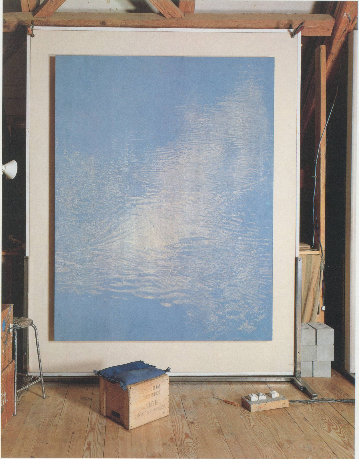
ATELIER FRANZ GERTSCH, APRIL 1991: Holzstock zu SCHWARZWASSER/wooden block for SCHWARZWASSER.