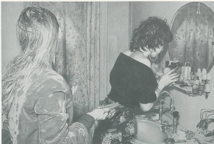
FRANZ GERTSCH, BARBARA UND GABY, 1974,

Acryl auf ungrundierter Baumwolle, 270 x 420 cm/acrylic on unprimed cotton, 106 \frac{1}{4} x 165 \frac{3}{8} ". (NATIONALGALERIE BERLIN)