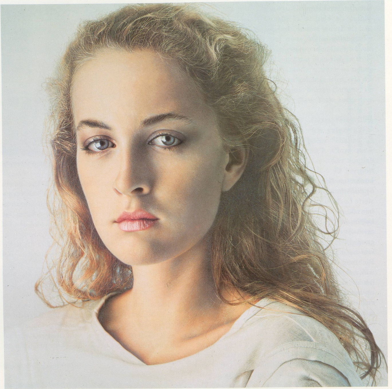
FRANZ GERTSCH, JOHANNA I, 1983, Acryl auf ungrundierter Baumwolle, 360 x 360 cm/acrylic on unprimed cotton, 141 3 / 4 x 141 3 / 4 ". (MUSEUM MODERNER KUNST WIEN)