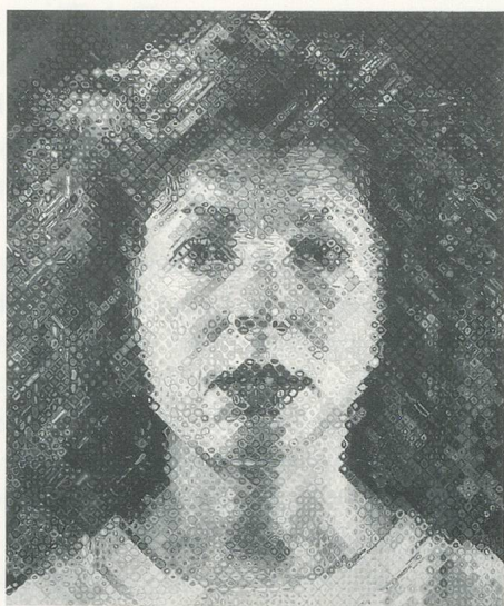
CHUCK CLOSE, APRIL, 1990-91, oil on canvas, 100 x 84"/Öl auf Leinwand, 254 x 213,4 cm.