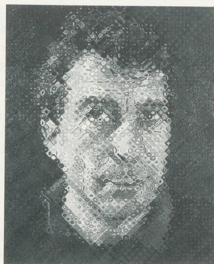
CHUCK CLOSE, BILL, 1990, oil on canvas, 100 x 84"/Öl auf Leinwand, 183 x 152,4 cm.

world of superstars and media hype more apt to a generation slightly younger than his; it is also for a bygone Elysium of craftsmanship, unsullied by the incongruities of Duchamp.