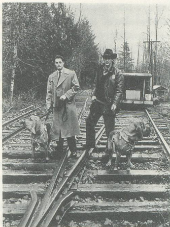
STILL FROM TWIN PEAKS

KATHY ACKER's most recent novel, In Memoriam to Identity , was published last year by Grove Press.