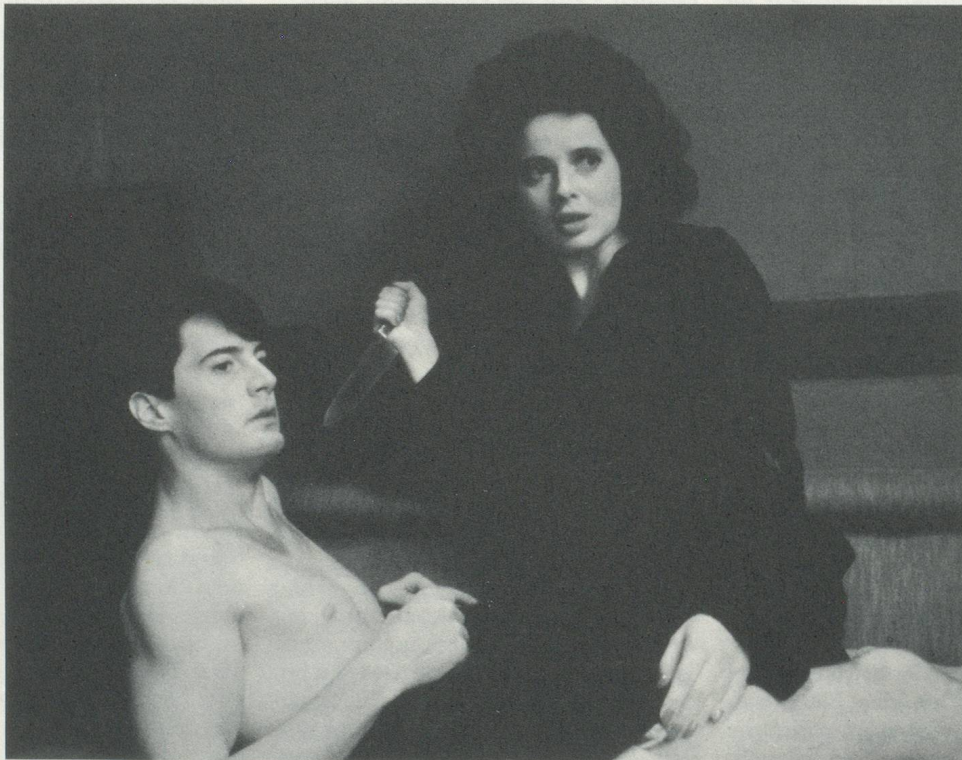
JEFFREY AND DOROTHY IN BLUE VELVET

(Übersetzung aus dem Französischen: Marianne Müller.)