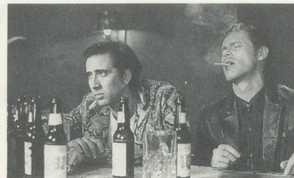
SAILOR AND BOBBY PERU IN WILD AT HEART

David gets back to the high brow and drops the horror of Gothic England for the wonder of serious sci-fi. He also learns about shooting big bucks in the studio crap game. Frank Herbert, H. R. Giger... and Sting? They call it Dune . Tim sticks to a low budget and makes a humble pomo masterpiece with the help of a very popular Saturday morning kid's show host—Pee Wee Herman. Jeff Koons sees Pee Wee's front garden and calls it art.