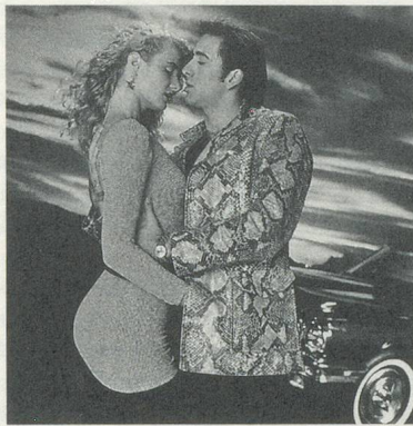
LULA AND SAILOR IN WILD AT HEART