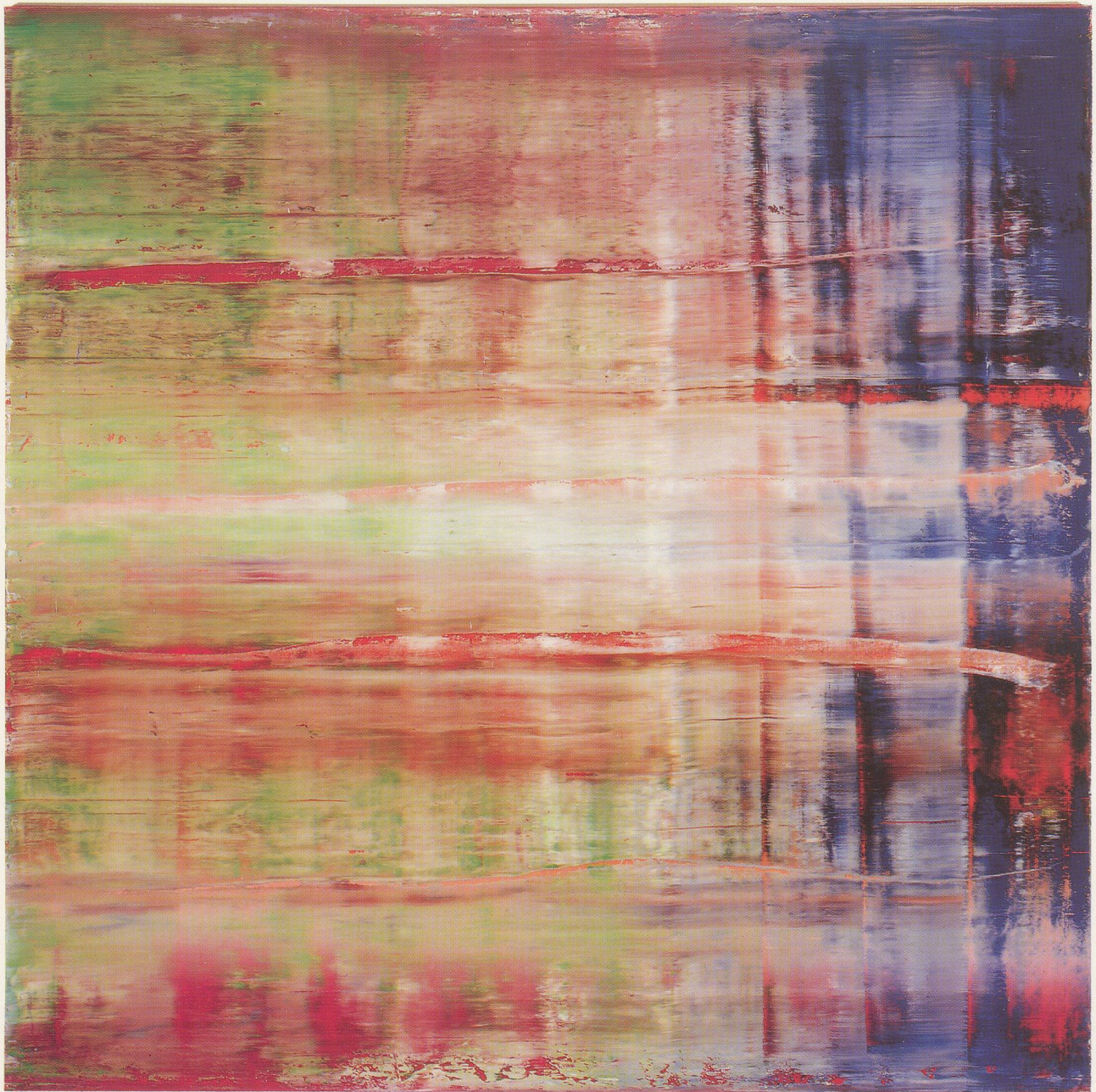
GERHARD RICHTER, ABSTRAKTES BILD (786), 1992, Öl auf Leinwand, 300 x 300 cm / ABSTRACT PAINTING (786), 1992, oil on canvas. 118 \frac{1}{8} x 118 \frac{1}{8} ".