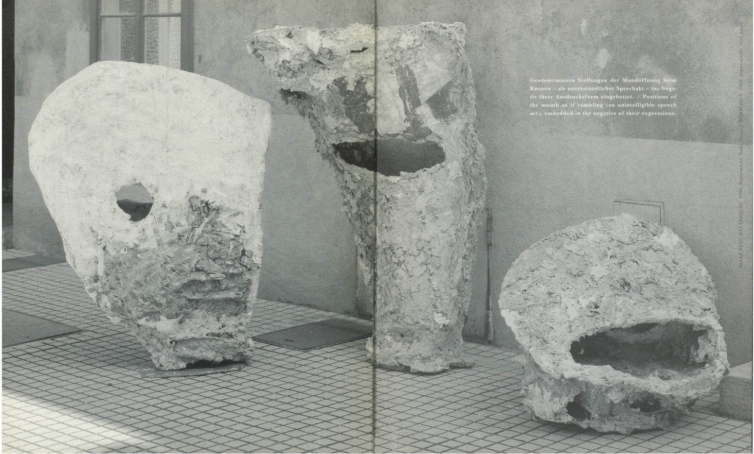
Gewissermaßen Stellungen der Mundöffnung beim Raunen – als unverständlicher Sprechakt – ins Negativ ihrer Ausdrucksform eingebettet. / Positions of the mouth as if rumbling (an unintelligible speech act), embedded in the negative of their expressions.

FRANK MEYER, DAS GEFÜHLE, 1976, Papiermache, Stahl, Eisen, Holz, Blei, 100 x 100 x 100 cm, 100 x 100 x 100 cm, 100 x 100 x 100 cm