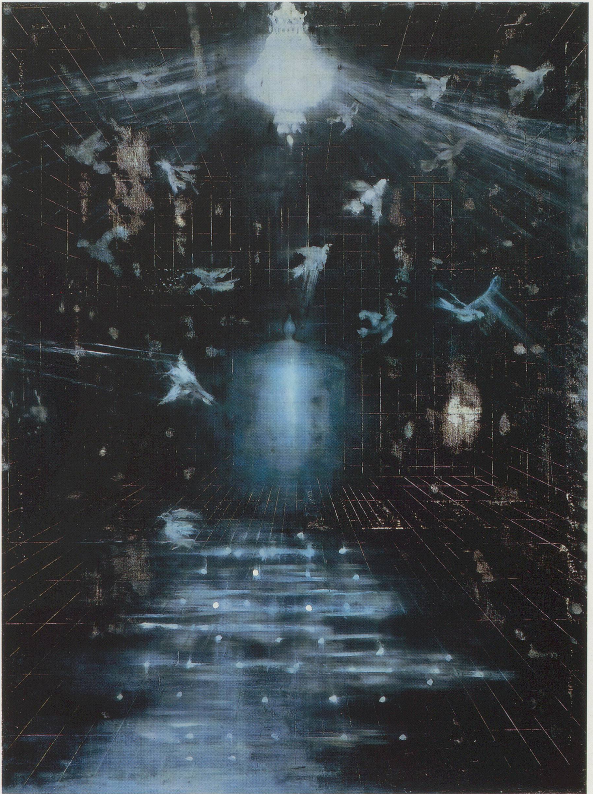
ROSS BLECKNER, THE FOURTH EXAMINED LIFE , 1988, oil on canvas, 96 x 72" / DAS VIERTE UNTERSUCHTE LEBEN , 1988, Öl auf Leinwand, 244 x 183 cm.