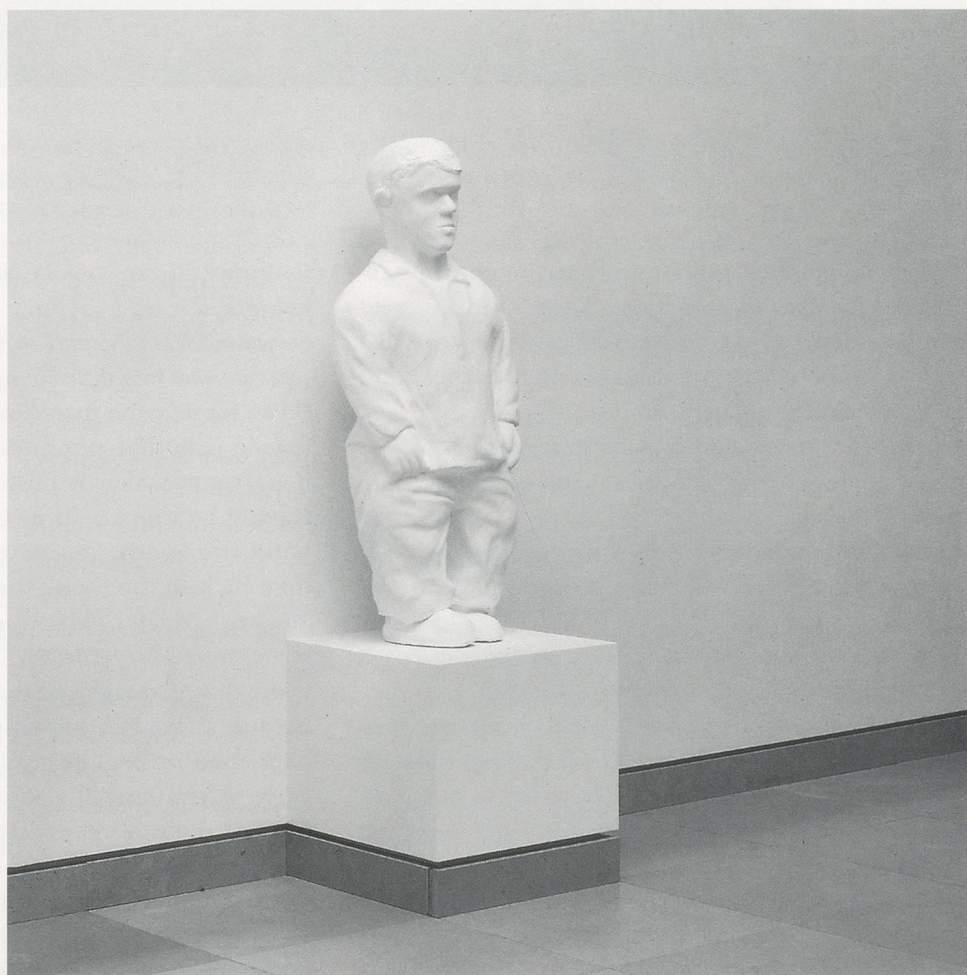
JUAN MUÑOZ, DWARF, 1994, papier-mâché, paint, wood, 42½ x 35 x 17½" / ZWERG, Pappmaché, Farbe, Holz, 108 x 88 x 44 cm, Musée de Nîmes.

Yes, but a very flat one. With one figure, nothing