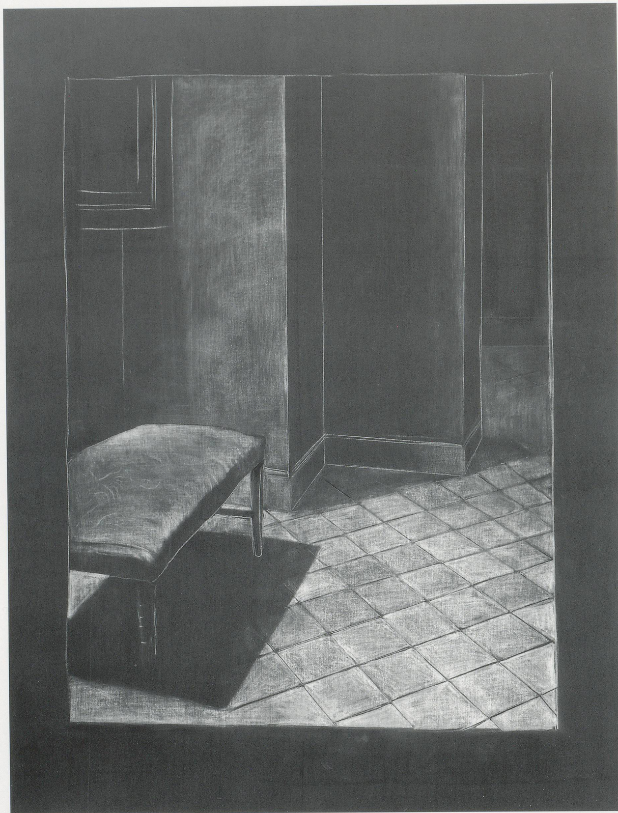
JUAN MUÑOZ, RAINCOAT DRAWING IV, 1989, chalk and oil on canvas, 79 x 59" / REGENMANTEL-ZEICHNUNG IV, Kreide und Öl auf Leinwand, 200 x 150 cm.