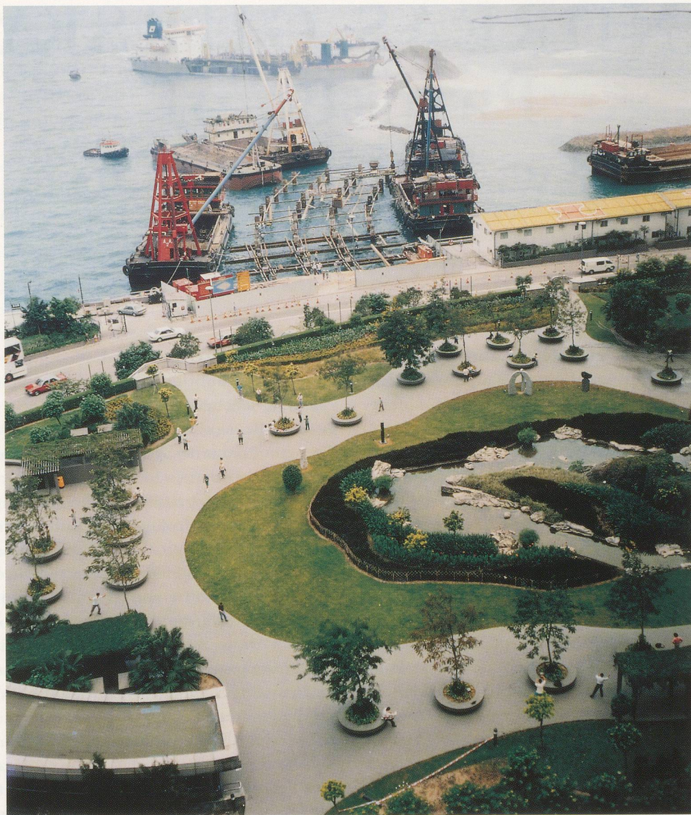
ANDREAS GURSKY, HONG KONG, GRAND HYATT PARK, 1994, 145 x 120 cm / 57 x 47 1/4".