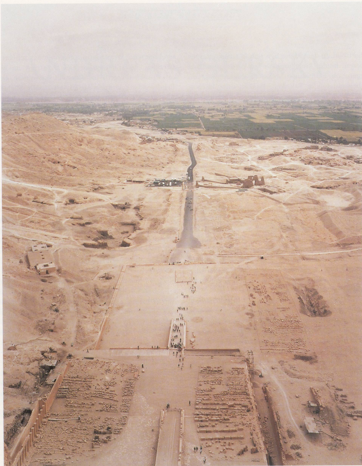
ANDREAS GURSKY, THEBEN WEST , 1993, 165 x 202 cm / THEBES WEST , 65 x 79½".