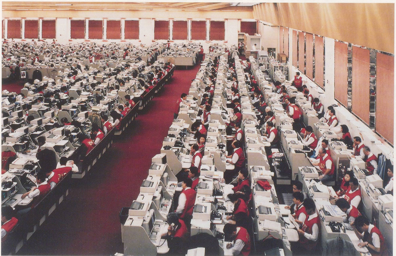
ANDREAS GURSKY, HONG KONG STOCK EXCHANGE, 1994, Dyptichon , je 160 x 220 cm / Dyptich , 63 x 86 \frac{7}{8} " each.