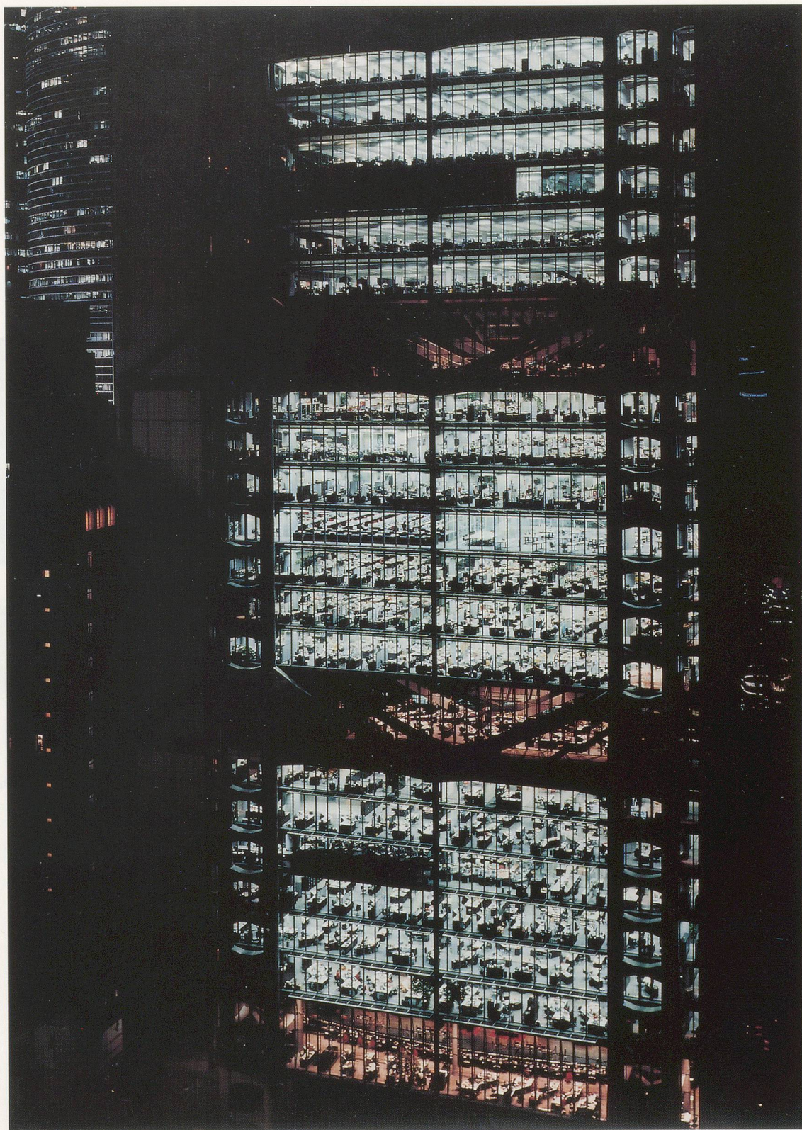
ANDREAS GURSKY, HONG KONG SHANGHAI BANK, 1994, 220 x 170 cm / 86 \frac{5}{8} x 67".