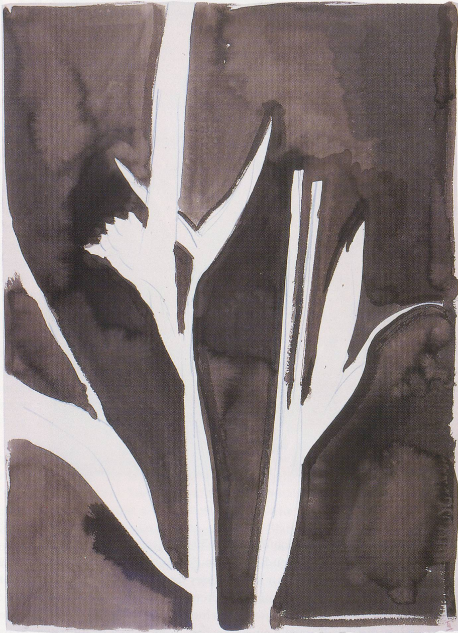
THOMAS SCHÜTTE, BLUMEN II, 1996, Aquarell, 56 x 76 cm / watercolors, 22 x 30".