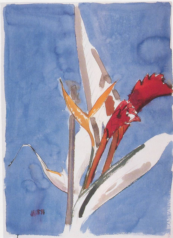
THOMAS SCHÜTTE, BLUMEN IV , 1996, Aquarell, 56 x 76 cm / watercolors, 22 x 30".