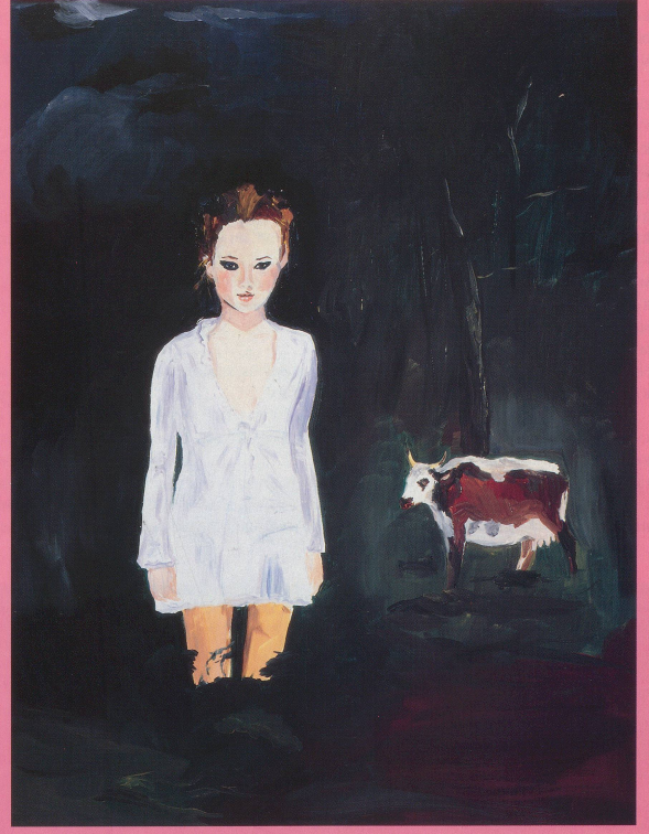
KAREN KILMINIK, BELGRAVE HALL , 1997, water-based oil on canvas, 18 x 14" / Emotions auf Leinwand , 45,7 x 35,6 cm.