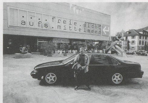
Jason Rhoades und sein «Museum des Zwischenraums» vor dem Kunsthaus Zürich am 4. Juni 1998 / Jason Rhoades and his "Museum of the In-Between" in front of the Kunsthaus Zurich.

Dieter gave him the courage to be aggressive, says Jason, barreling along at 110 mph: "I'm surprised how well the Swiss take to such fucked-up art and that museum people have learned from Roth not just to show art but to maintain and entertain it." Edibles are not the only things infected by Roth, the mold(er). This human cascade of objects and words instigated similarly rotting processes in his environment