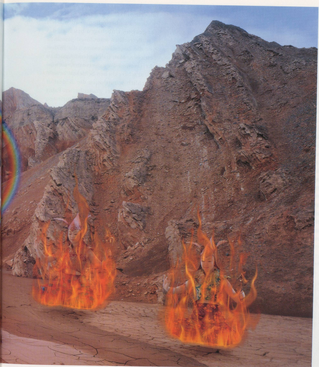
MARIKO MORI, BURNING DESIRE, 1996-98, color photograph on glass, 10' x 20' x 13/16", 5 panels, each 4' wide /