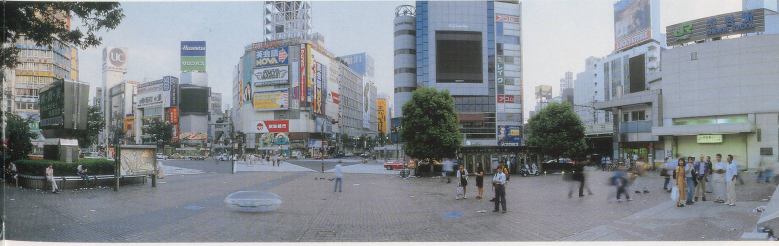
MARIKO MORI, BEGINNING OF THE END, SHIBUYA, TOKYO, 1995, crystal print, wood, pewter frame, 39" x 16" 5" x 3" / ANFANG VOM ENDE, SHIBUYA, TOKIO, Crystal-Print, Holz, Zinnrahmen, 100 x 500 x 7,6 cm.