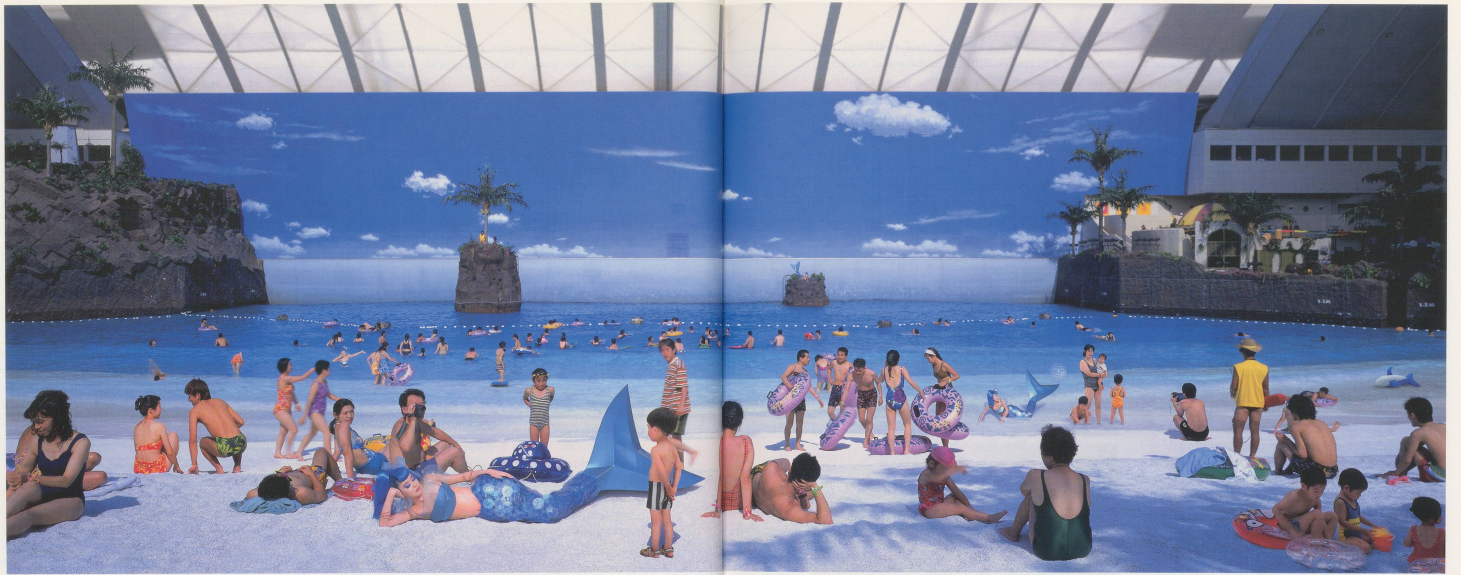
MARIKO MORI, EMPTY DREAM , 1995. c-print, aluminum, wood, smoked chrome aluminum frame, 9' x 24' x 3" / LEERER TRAUM, C-Print, Aluminium, Holz, rauchschaars verchromter Aluminiumrahmen, 274 x 732 x 7,6 cm.

gy of distanciation and analysis than by impersonation: She uses her body as a lens that captures the light of the contemporary image-stream, and through certain enhancements and exaggerations makes it clear what the image-stream really wants of us. In the first place, it appears keen to eliminate any residual sense of the historical: Allusions to Mayan, Indian, Egyptian, Greek and Chinese art are laid out on the