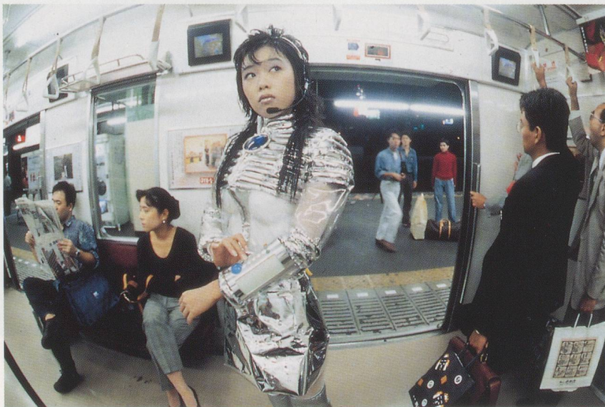
MARIKO MORI, SUBWAY , 1994, super gloss Duraflex print, wood, pewter frame, 27 x 40 x 2" / U-BAHN, Hochglanz-Duraflex-Print, Holz, Zinnrahmen, 68,6 x 101,6 x 5,1 cm.

Dass es Mori's Absicht ist, mit den durch die gegenwärtige Bilderflut in Gang gesetzten Kräften zu wetteifern oder diese zu übertreffen, wird wie ich glaube durch ein gewisses Unbehagen bestätigt, das ihre Bilder beim Betrachter auszulösen imstande sind – als hätte sie die Zugeständnisse an die Bilderflut allzu weit getrieben. Man hält laufend Ausschau nach Zeichen kritischen Bewusstseins, als würden sie uns vor dem schrecklichen Schicksal bewahren können, tatsächlich schutzlos in die Bilderflut getaucht zu werden, wie auf der grauenhaften Fahrt durch einen Vergnügungspark, wo es kein Entrinnen gibt, während Galaxien und Planeten vorbeirasen und einem zunehmend übel wird. Tatsächlich findet man solche Zeichen kritischen Bewusstseins, besonders in Mori's Arbeiten der frühen 90er Jahre, die in der Regel eine der Bilderflut entsprungene Kreatur zeigen, die plötzlich in der realen Welt auftaucht: in einem U-Bahn-Waggon, einem Spielsalon, einem Bürogebäude. Diese Arbeiten tun ihre kritische Botschaft laut und deutlich kund: Man sieht genau, wo und wie sich das psychische Verhängtsein in der Bilderflut ins grössere sozioökonomische Bild fügt. Die Figuren der futuristischen Gestalt in SUBWAY (U-Bahn), des unwiderstehlichen Sailor Moon-Girls 1) in PLAY WITH ME (Spiel mit mir) und der feenhaften Bürodame in TEA CEREMONY III (Teezeremonie III) sind direkt aus ihrem jeweiligen gesellschaftlichen