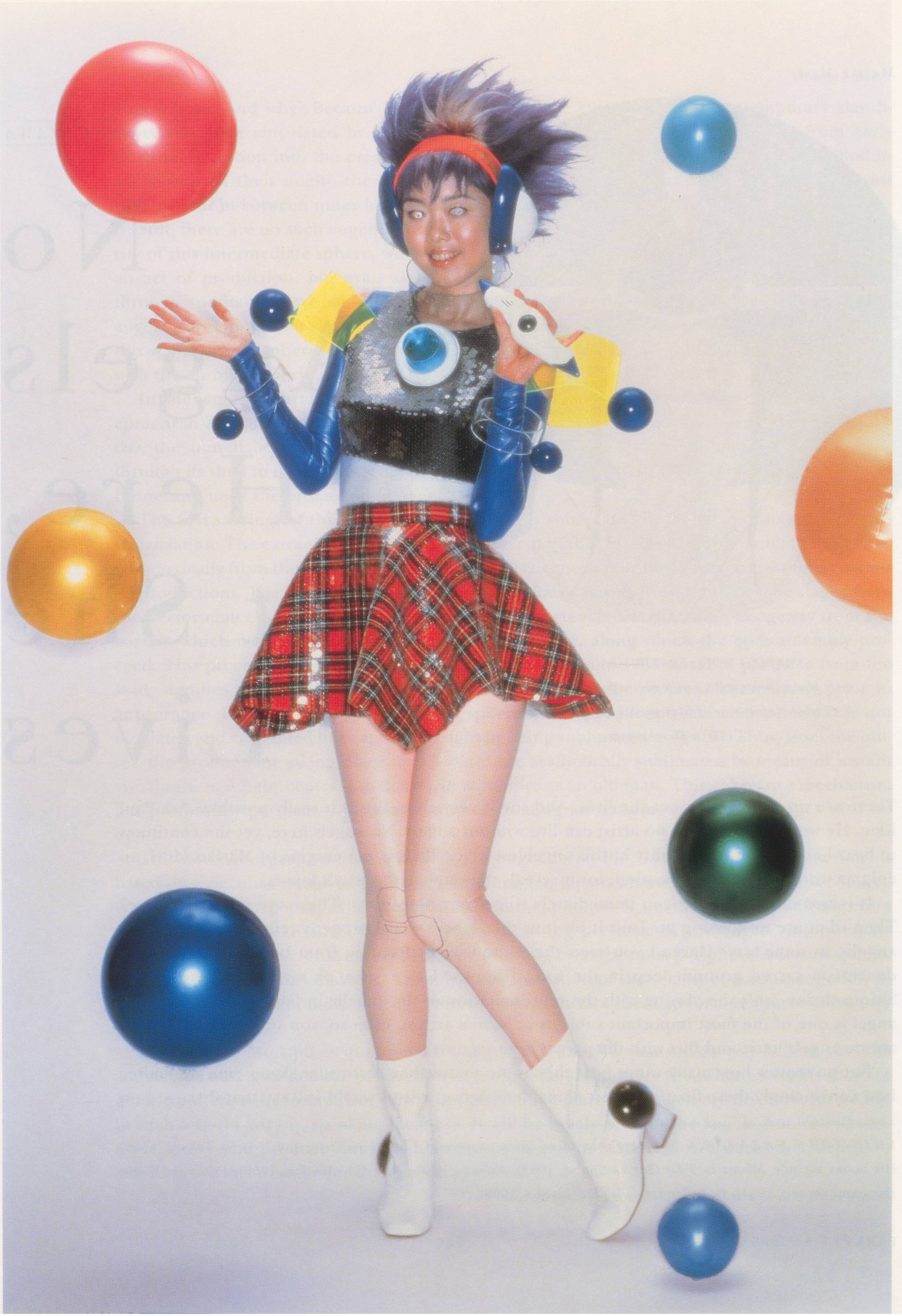
MARIKO MORI, BIRTH OF A STAR, 1995, Duratrans print, acrylic, light box, and audio CD, 72" x 48" / GEBURT EINES STARS, Duratrans-Print, Acryl, Leuchtkasten und Audio-CD, 183 x 122 cm.