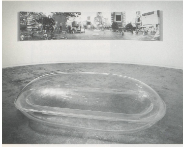
MARIKO MORI, BODY CAPSULE, 1995, and BEGINNING OF THE END, SHIBUYA, TOKYO, 1995, installation view at Deitch Projects, New York / KÖRPERKAPSEL und ANFANG VOM ENDE, SHIBUYA, TOKIO.

hegt: Es ist von entscheidender Bedeutung, dass nicht der geringste Hauch eines Misstons, einer gesellschaftlichen oder seelischen Unruhe die erhabenen Gleitbewegungen der techno-imaginären Maschinerie stört. Die Neutralisation der Sexualität ist dabei von höchster Wichtigkeit. Wohl gemerkt, nicht die Unterdrückung der Sexualität: Da ist nichts Strenges oder Puritanisches an der Triebökonomie, die Mori in ihren Werken vorführt. Im Gegenteil, es ist wichtig, dass die sexuelle Energie innerhalb des visuellen Systems frei zirkulieren kann. Aber sie muss leidenschaftslos bleiben: eine Sexualität ohne vulgären Ausdruck oder Risiko und ohne grosse Tristan- und Isolde-Momente; eine Sexualität, die unauffällig auf das Kindliche zudrückt, in der kindlich gleichbedeutend ist mit unwiderstehlich. Es ist interessant, dass Moris Bildsprache gerade in der westlichen Unterscheidung von prä-sexueller Kindheit und Adoleszenz oder Erwachsenenalter, wo die Sexualität für das im Subjekt verbliebene Rebelle und Wilde steht, ein Störungspotential ausmacht. Moris Bildsprache löst diesen Gegensatz auf: Sie sexualisiert das Kind, während sie den Erwachsenen infantilisiert. Moris Verkörperungen weiblicher Sexualität halten hartnäckig an einer Kinderzimmerwelt der Pastellfarben und runden Schmusformen fest: Barbarella und Bardot müssen My Little Pony weichen. 3)