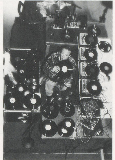
Christian Marclay, Art at the Anchorage, Creative Time, 1997.

Grammophon als Medium und Ort alternativer akustischer und visueller Experimente, unabhängig von den Jubiläumsfeiern, eine lange, bemerkenswerte, wenn auch oft unbeachtete Geschichte hat. Das erfreulich Unkonventionelle dieser kreativen Erforschung der Techno-Logiken des mechanisch reproduzierten Klangs durch verschiedenste künstlerische Verfahren – visuelle und akustische Performance, skulpturale und graphische Elemente (gelegentlich auch kombiniert) – mag zu ihrer Nichtbeachtung beigetragen haben; teilweise ist diese wohl auch auf ihre Unvereinbarkeit mit dem Hang zur Ausgrenzung einer in rigiden Kategorien denkenden Kunst- und Kunsthistoriker-Szene zurückzuführen. Doch trotz der Vernachlässigung durch die Kritik ist die kreative «Grammophonie» (in Ermangelung einer besseren Bezeichnung) ein erstaunlich vitaler und je länger, je mehr auch anerkannter Bereich der zeitgenössischen Kunst. Man könnte in diesem Zusammenhang über ein breites Spektrum