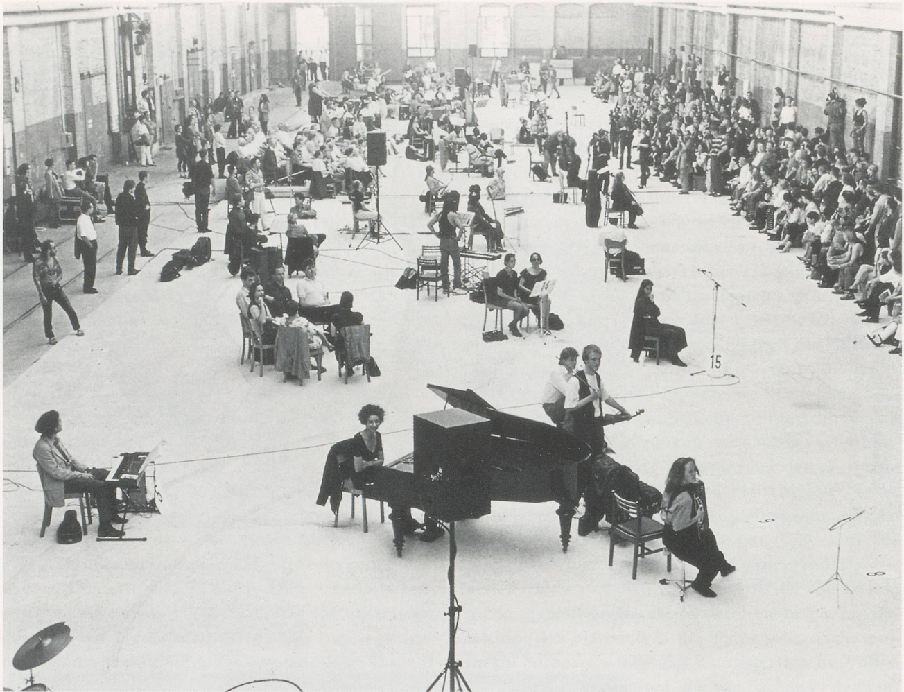
CHRISTIAN MARCLAY, BERLIN MIX , 1993, performance / BERLINER MIX , Performance im Strassenbahndepot, Berlin.

wollten, wie es klingt, wenn man eine Platte zerbricht, werden fasziniert sein von dem enormen Reichtum an rhythmischen, beinahe schon fugenähnlichen Beispielen dieser transgressiven Geste, die den dramatischen Höhepunkt der Performance darstellt. Weniger augenfällig ist, dass diese Geste, wenn auch unter strikteren Bedingungen, jene der Produktionsweise von Marclays Serie der Recycled Records (Rezyklierten Platten) aus den frühen 80er Jahren ist. Es handelt sich dabei um phonographische Montagen aus zerbrochenen und anschließend sorgfältig zurechtgeschnittenen und zu einem mosaikartigen Ganzen zusammengeklebten Platten. Auf eine Art, die an Milan Knizaks in den 50er Jahren angewandte Fluxus-Methoden erinnert, an das Versengen, Zerkratzen, Bemalen, Zerschneiden und Zusammenset-