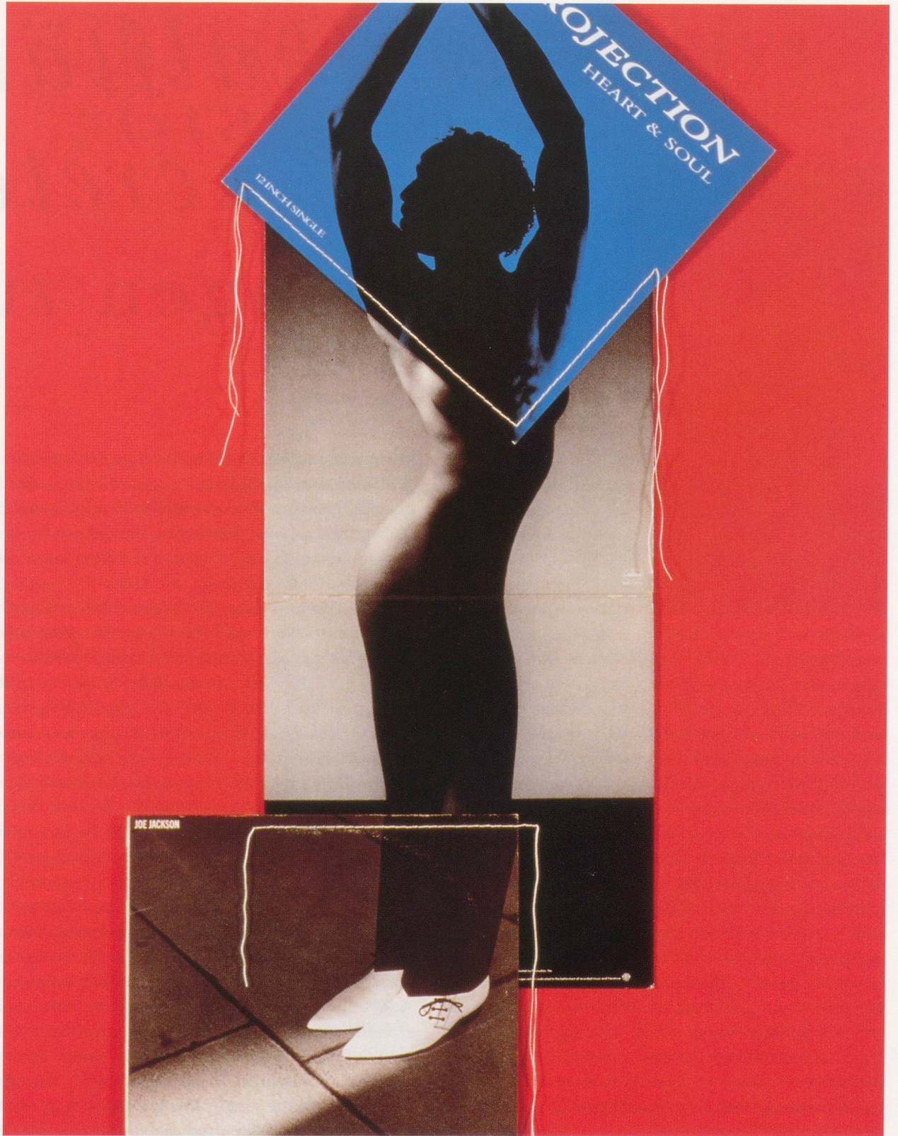
CHRISTIAN MARCLAY, LOOK SHARP, 1991, record covers and thread, 40½ x 20" / HEISS AUSSEHEN, Plattenhüllen und Bindfäden, 102,9 x 50,8 cm.