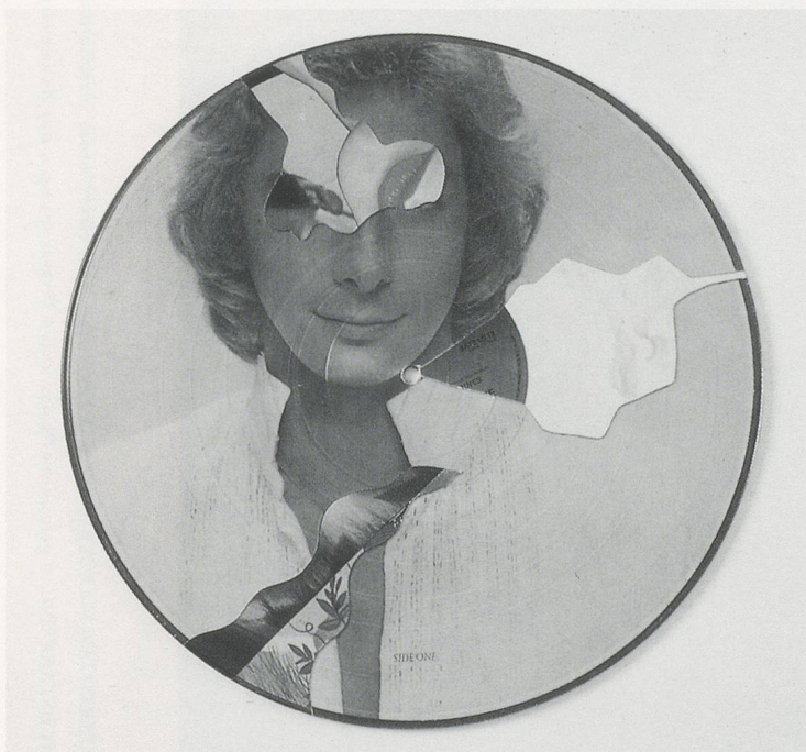
CHRISTIAN MARCLAY, RECYCLED RECORDS , 1984, collage / REZYKLIERTE SCHALLPLATTEN, Collage.

reflections on the techno-pragmatics of gramophone vs. CD error production, see the discussion between Marclay and Tone in Music (NYC) No. 1 (1997), pp. 39–46.