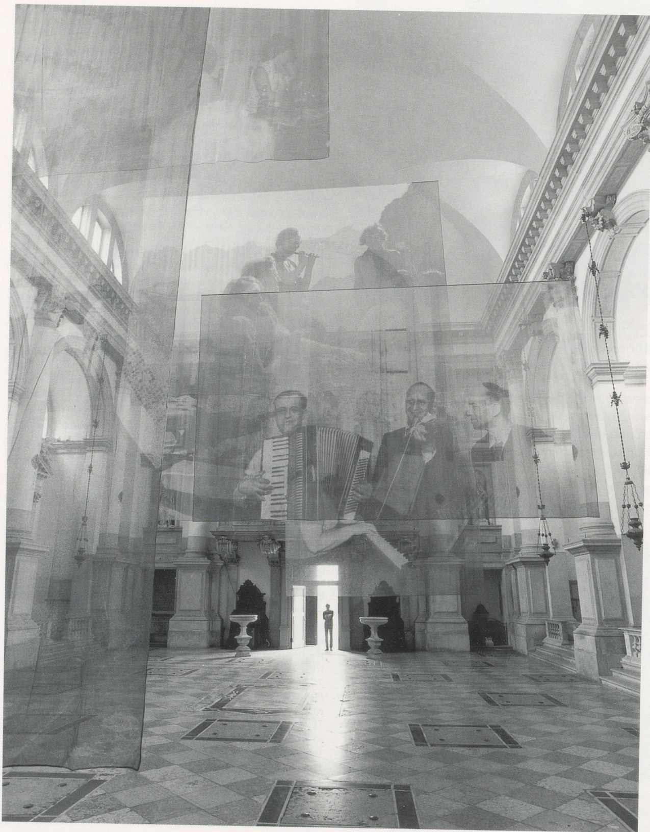
CHRISTIAN MARCLAY, AMPLIFICATION, 1995, mixed media installation with 6 found photographs and 6 photographic enlargements on scrim, San Slaè, Venice Biennale 1995 / VERSTÄRKUNG, 6 gefundene Photos und 6 Vergrößerungen auf Baumwollgaze.