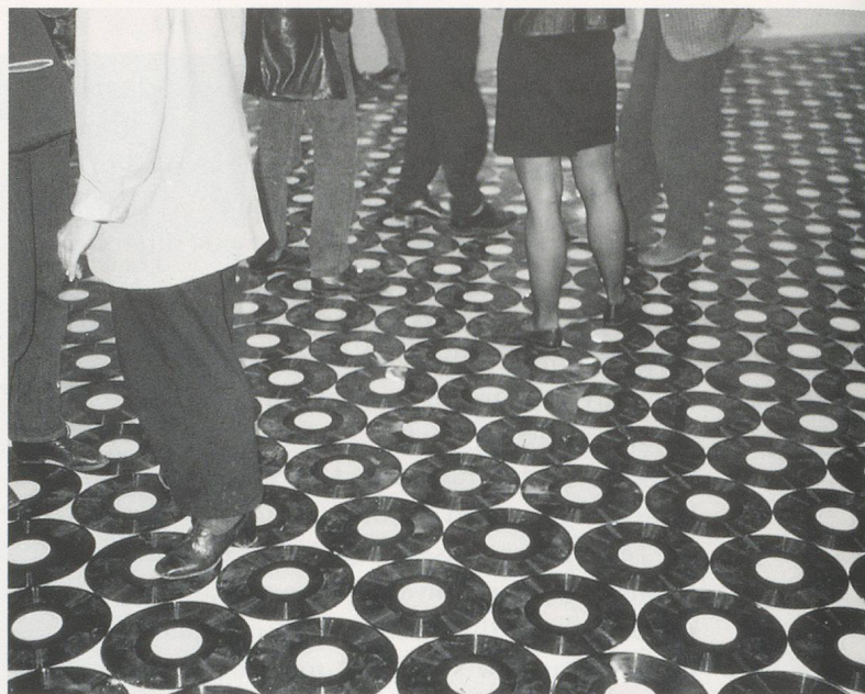
CHRISTIAN MARCLAY, FOOTSTEPS , 1989, 3500 vinyl records, installation, Shedhalle Zurich / SCHRITTE , 3500 Vinylschallplatten.

his "live" and his artefactual practices as performative presentations of the central semiotic signature of gramophonic inscription—that is the index.