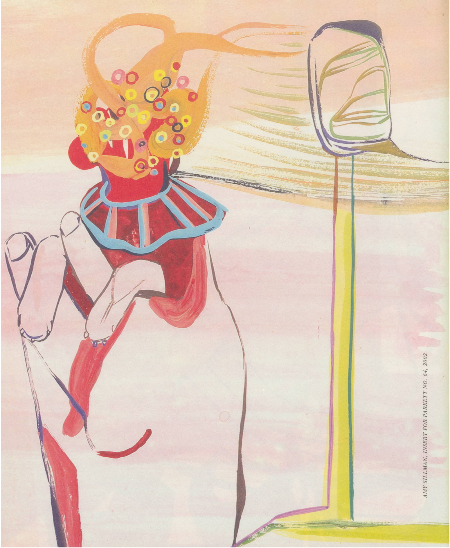
AMY SILLMAN, INSERT FOR PARKETT NO. 64, 2002