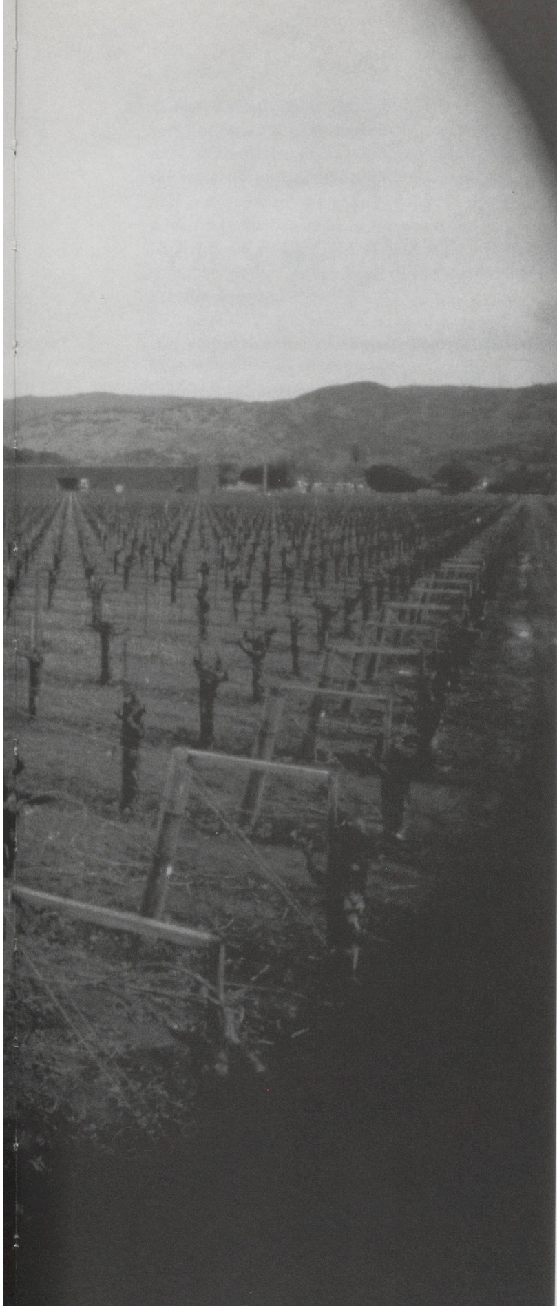
JEFF WALL, DOMINUS WINERY (1996–1998), YOUNTVILLE, NAPA VALLEY, CALIFORNIA. ARCHITECTS: HERZOG & DE MEURON, 1999, gelatin silver print, 197,3 x 257 cm (image), edition of 3 / WEINGUT DOMINUS. ARCHITEKTEN: HERZOG & DE MEURON. (COLLECTION CENTRE CANADIEN D'ARCHITECTURE/CANADIAN CENTRE FOR ARCHITECTURE, MONTRÉAL; AMERICAN FRIENDS OF THE CCA/GIFT OF SEAGRAM CHATEAU & ESTATE WINES COMPANY. COPYRIGHT BY JEFF WALL)