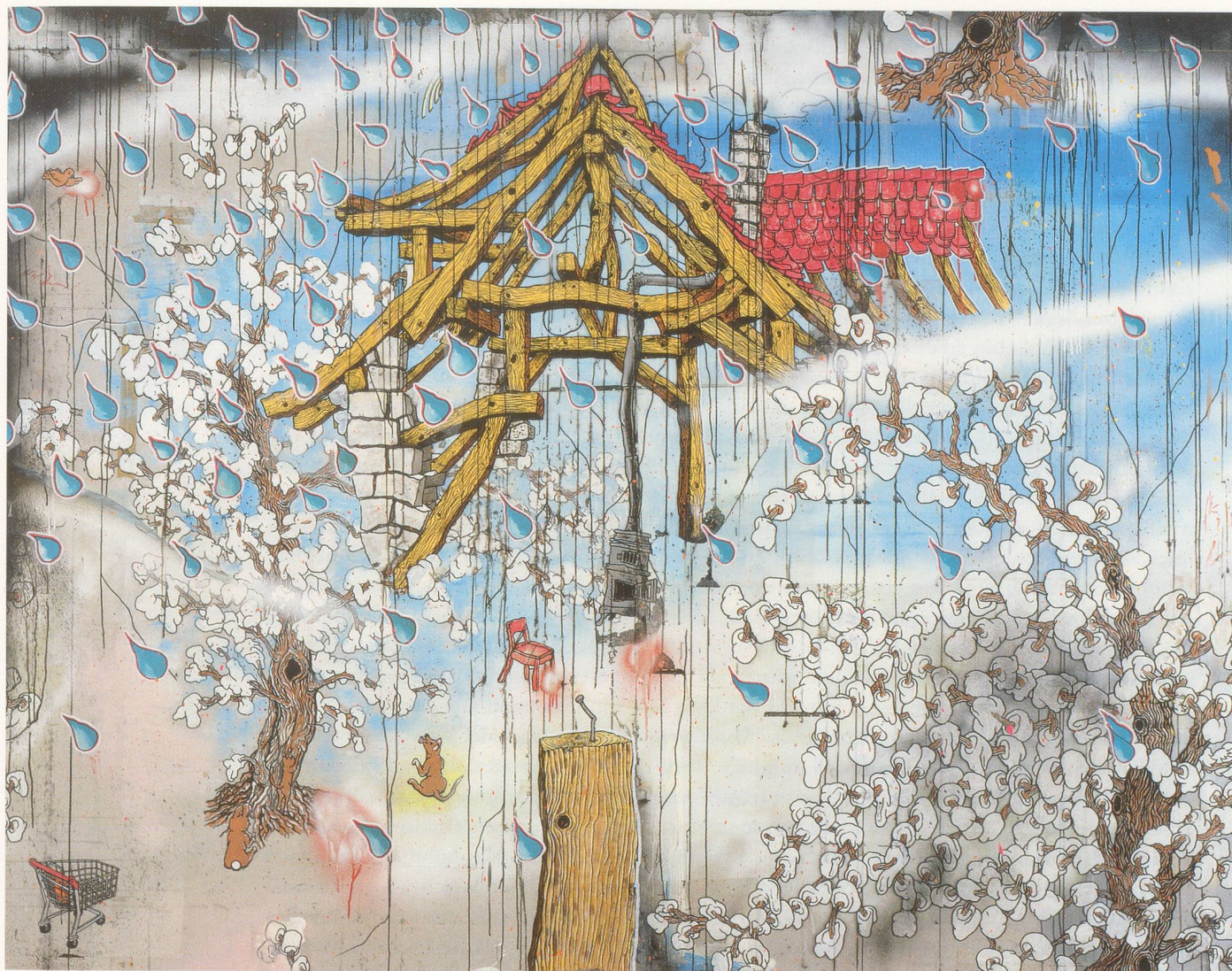
URS FISCHER, THE TRICK IS TO KEEP BREATHING, 2001, mixed media on wood, 86 3 / 8 x 110 5 / 8 " / Mischtechnik auf Holz, 219,5 x 281 cm.