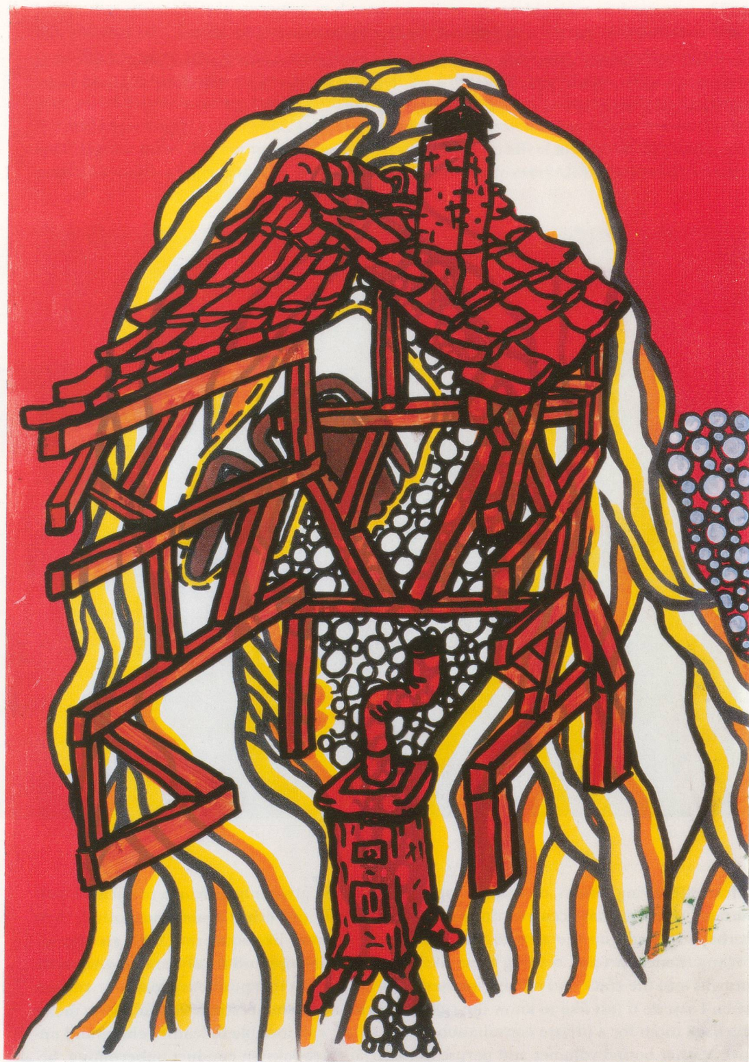
URS FISCHER, SCENES FROM THE INTERNAL BACKDROP (part 1 of 5), 2000, mixed media on paper, framed by the artist, 16 1/2 x 11 1/2" / Mischtechnik auf Papier, vom Künstler gerahmt, 42 x 29,3 cm.