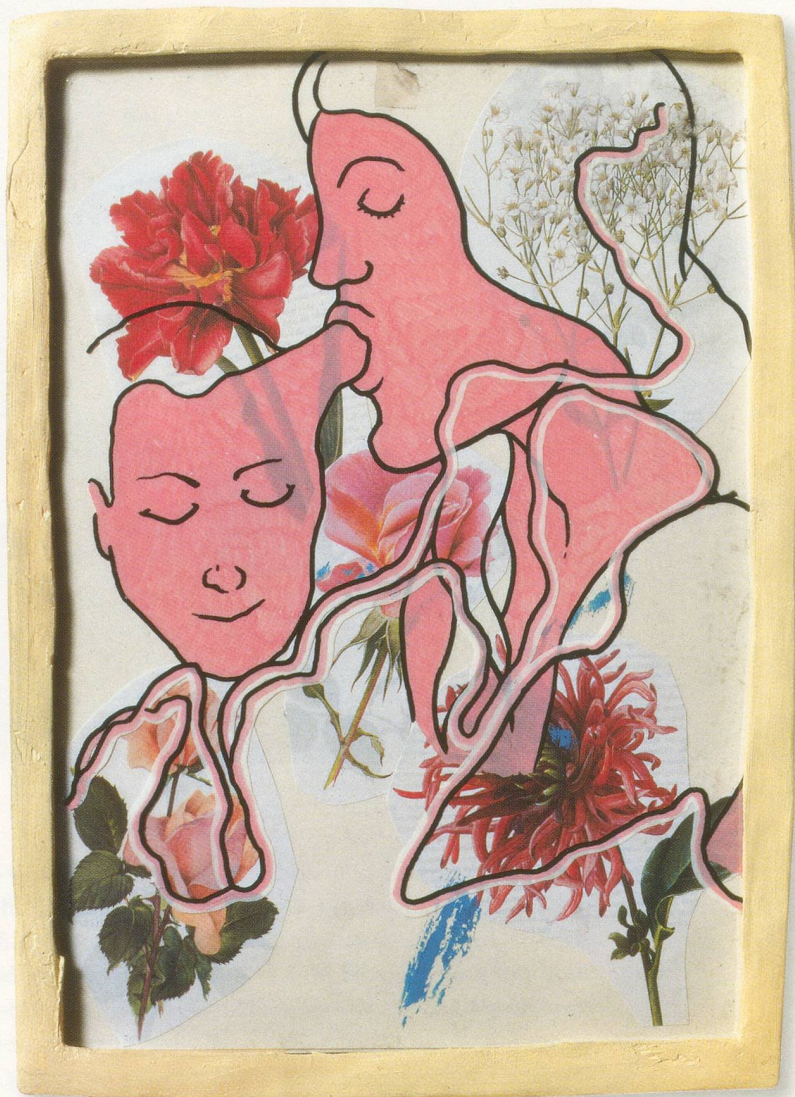
URS FISCHER, DENKST DU AUCH SO VIEL AN DICH WIE ICH, 2001, Mischtechnik auf Papier, vom Künstler gerahmt, 42 x 29,3 cm / mixed media on paper, framed by the artist, 16 1/2 x 11 1/2".