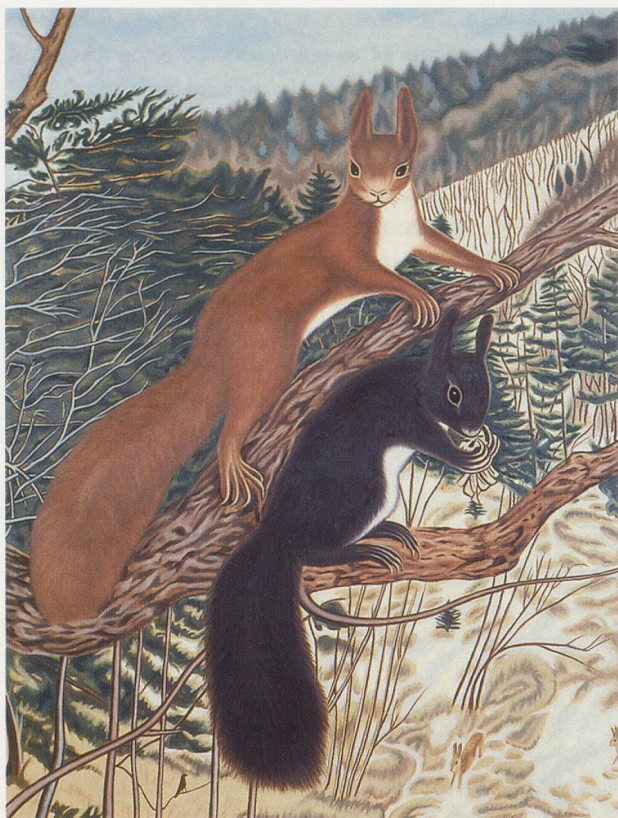
RICHARD PHILLIPS, SIMILAR TO SQUIRRELS AFTER A. DIETRICH , 2003, oil on linen, 102 1/2 x 78"/ EICHHÖRNCHEN NACH A. DIETRICH , Öl auf Leinen, 260,4 x 198,1 cm.

Goldstein's pictures are radical—in their ambivalence and discursivity, their obstinate refusal to specify meaning, allowing it to hover dangerously at peripheries, opening a fissure in our expectations of representation. 4