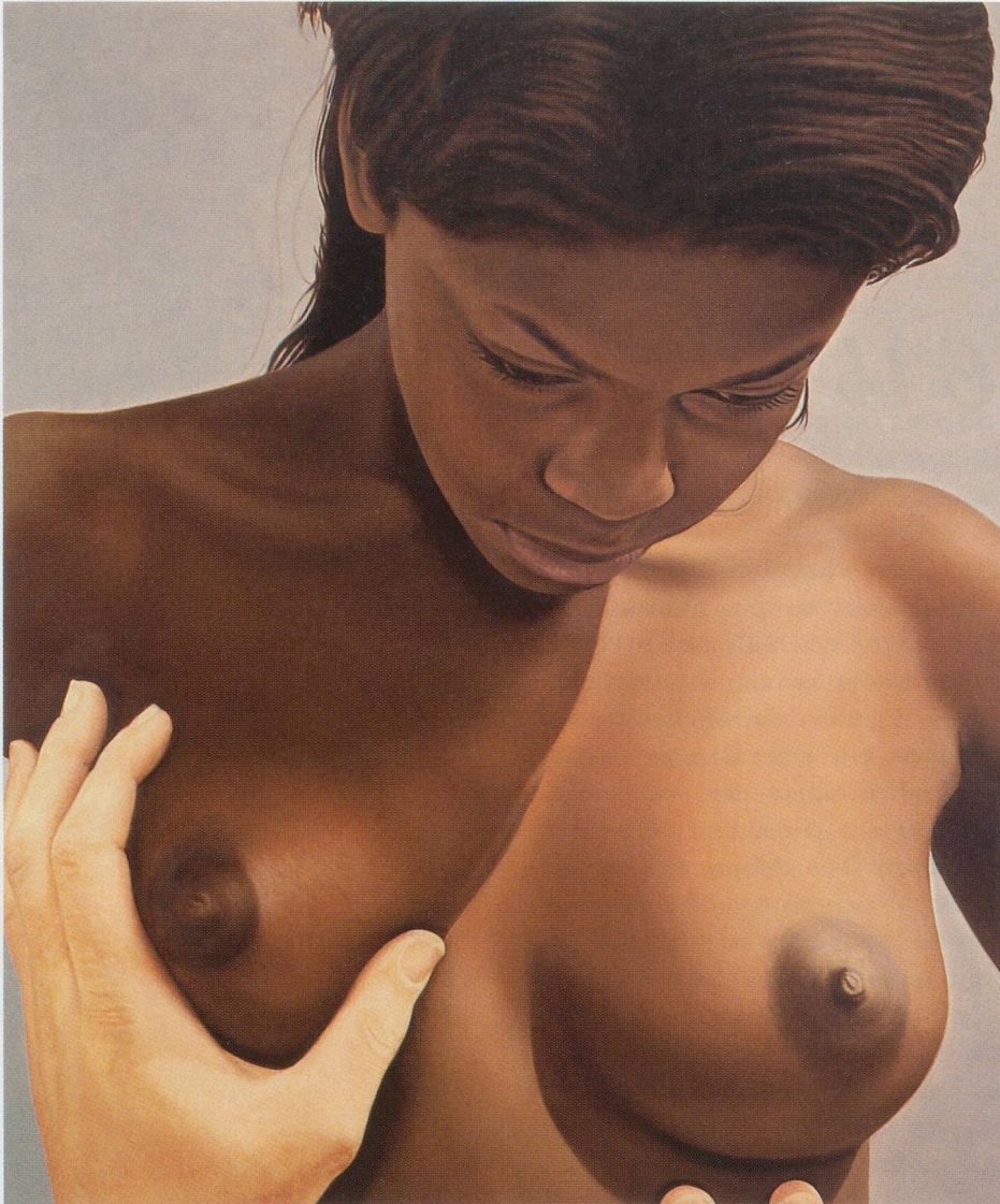
RICHARD PHILLIPS, BLESSED MOTHER , 2000, oil on linen, 84 x 72" / GESEGNETE MUTTER , Öl auf Leinen, 213,4 x 182,9 cm.

einer projizierten Dollarnote überlagerten, nackten Frau, dem eine Ausgabe des Playboy aus den 60er Jahren zugrunde liegt (§, 2003); schliesslich die Nahaufnahme des Kopfes einer knienden Frau, deren Haar mit Sperma bekleckert ist (BUKKAKE, 2004). Wie kann man diese Bilder zusammenbringen, und wie lässt sich Phillips' Konzept der thematischen Gemeinsamkeit dieser Bilder erklären? Wie reagieren wir auf die breiter gestreuten Bildquellen, die sich