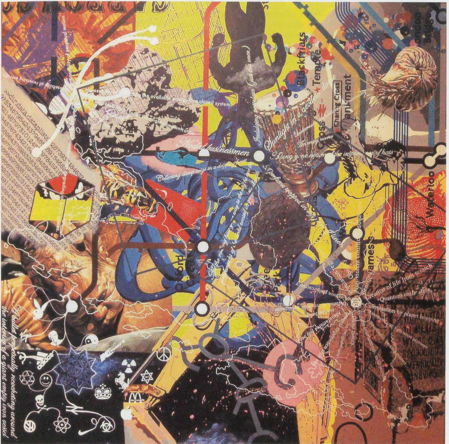
KEITH TYSON, SOUP PAINTING 2 (PRIMORDIAL SOUP), 2003, acrylic on aluminum, central panel, 120 x 120" / SUPPENBILD 2 (URSUSPE), Acryl auf Aluminium, Mittelbild, 305 x 305 cm.