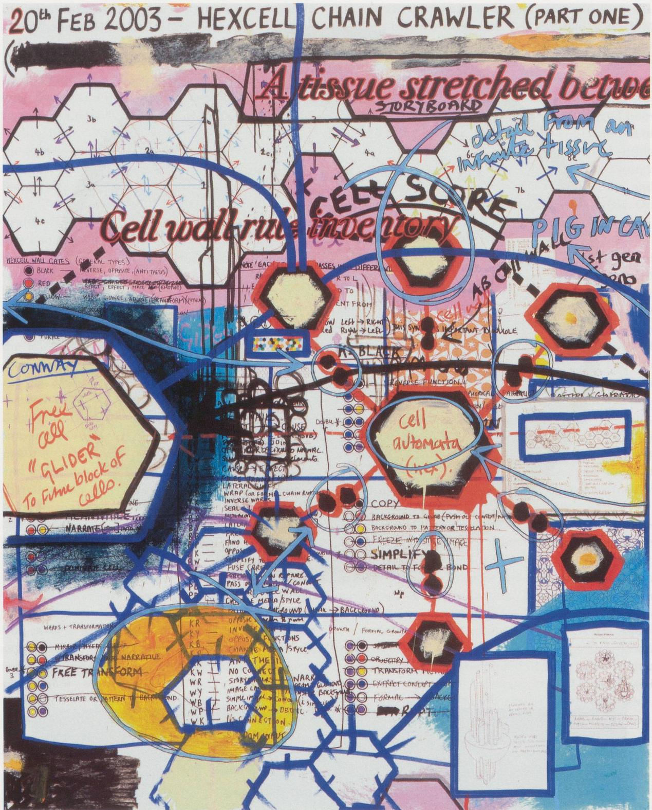
KEITH TYSON, STUDIO WALL DRAWING: 20 TH FEB. 2003 - HEXCELL CHAIN CRAWLER (PART ONE), 2003, mixed media on paper, 61 13/16 x 49 5/8" / ATELIERWANDZEICHNUNG: 20. FEB. 2003 - HEXZELLEN-KETTENRAUPE (TEIL EINS), Mischtechnik auf Papier, 157 x 126 cm.