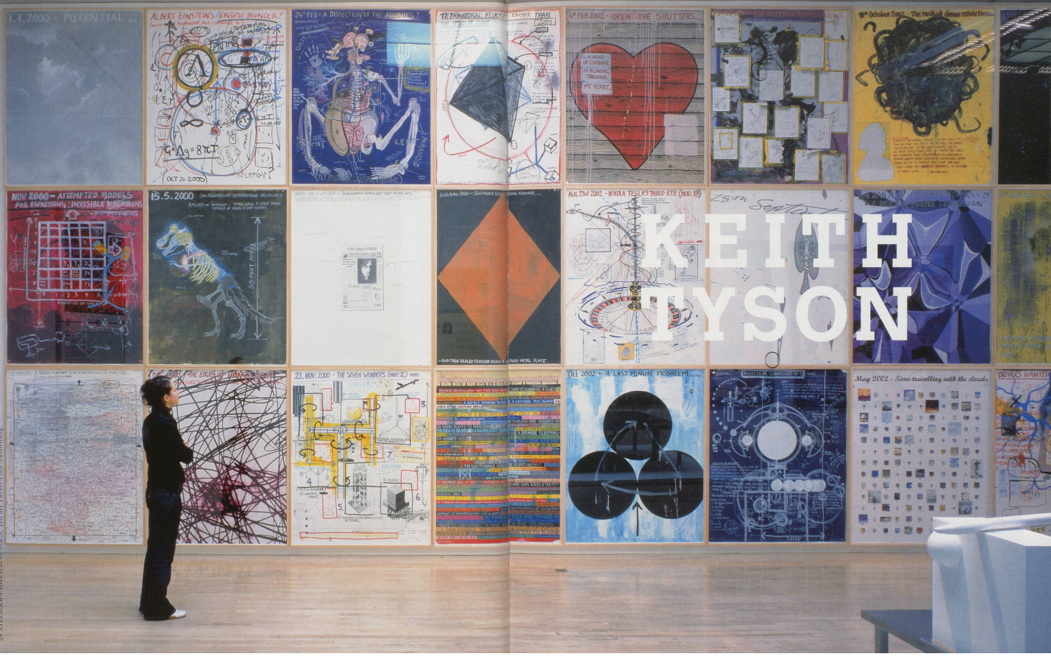
KEITH TYSON: Installation view of 24 STUDIO WALL DRAWINGS, part of the Turner Prize exhibition at Tate Britain, London, 30 Oct. 2002 - 3 Jan. 2003 / 24 ATELIERWANDZEICHNUNGEN, Teil der Turner-Preis-Ausstellung.