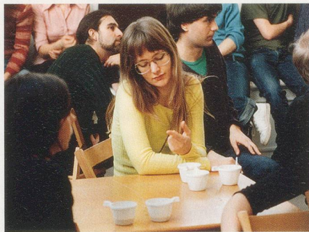
JOHANNA BILLING, PROJECT FOR A REVOLUTION , 2000, video loop, 3 min. 10 sec. / REVOLUTIONSPROJEKT , Videoloop, 3 Min. 10 Sek.

sions are ultimately based on the pressures of society and how this relationship must always be seen in dialectical terms. Thus, for a brief moment, the perspective switches from the registering, observing gaze of the diver to her subjective view. Allegorically, the scene evokes the conventional topoi of high-performance athletics. Alone and undaunted, artists at the edge of the abyss brave the harsh gaze of criticism high above the heads of all others.