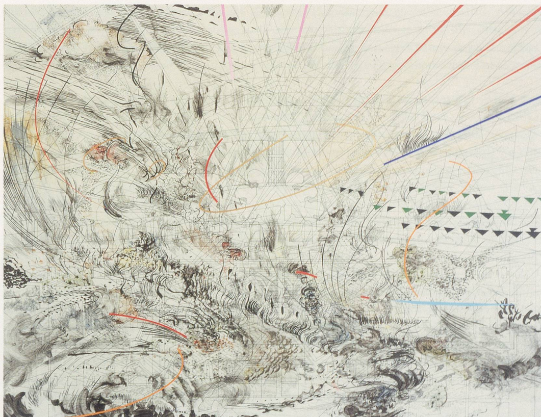
JULIE MEHRETU, ALTER, 2005, ink and acrylic on canvas 3 x 4' / ÄNDERN, Tusche und Acryl auf Leinwand, 91 x 122 cm.

Ich bin nicht mehr so sehr am Rhetorischen und Politischen interessiert wie früher, sagt Julie, als wir in ihrem neuen Atelier stehen. Das Symbolische reizt mich, ich will einfach nur da eine Linie ziehen, dort einen Kringlel, vielleicht sogar ein Farbmoment und mich davon