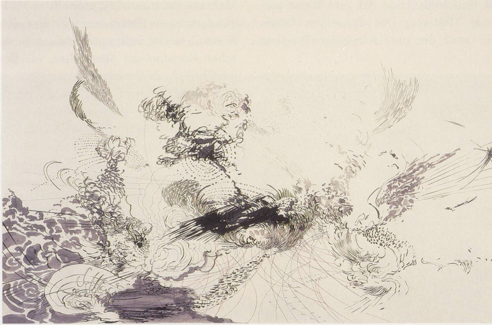
JULIE MEHRETU, UNTITLED, 2005, ink and graphite on paper, 26 x 40" / OHNE TITEL, 2005, Tusche und Graphit auf Papier, 66 x 101 cm.