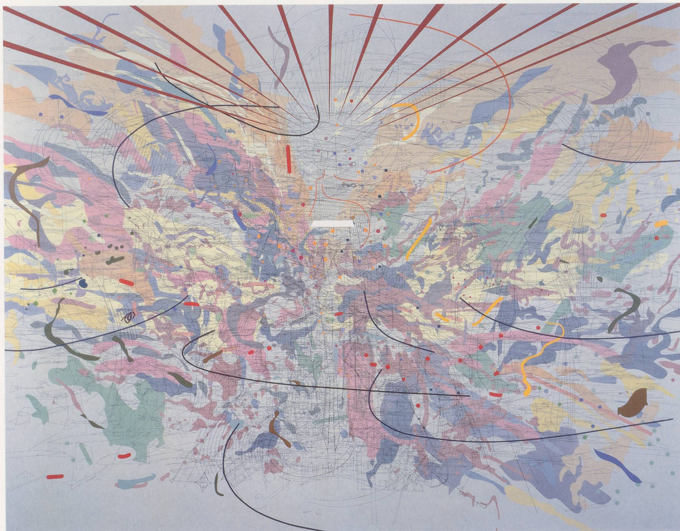
JULIE MEHRETU, LOOKING BACK TO A BRIGHT NEW FUTURE , 2003, ink and acrylic on canvas, 95 x 119" / BLICK ZURÜCK AUF EINE SCHÖNE NEUE ZUKUNFT , Tusche und Acryl auf Leinwand, 241 x 302 cm.